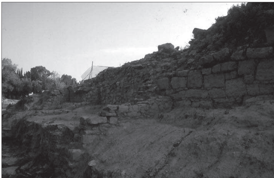
Figura 2. Vista general dels trams de fortificació descoberts. En primer terme el primer tram de l'ampliació de cap al 400 aC; després, l'escala que arrenca de la porta 5 i, al fons, el parament de la muralla vella.

de l'ampliació va ser integrat a l'interior del poblat, i en el qual es van construir noves edificacions, implantades en terrasses descendents en sentit oest est (figura 3).