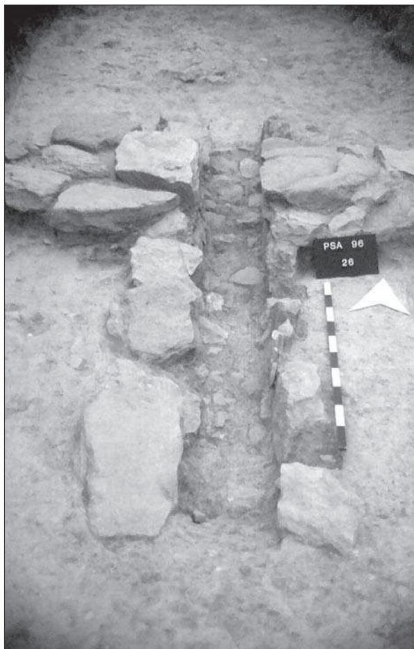
Figura 4. Detall del desguàs que travessava la porta 4

cals en dues fileres paral·leles. Té una amplada d'entre 28 i 31 centímetres, i el fons està recobert amb pedres i còdols, amb una petita inclinació del sud cap al nord. Per l'interior del poblat, en el lloc en què la canal es perd, queda integrada al paviment més vell de petits còdols. Pel costat exterior del llindar l'excavació del 56 havia arribat al terreny natural. Pel costat interior també s'hi havia arribat, a bona part del sector excavat, exceptuant en els llocs especificats que conserven restes de pavimentació.