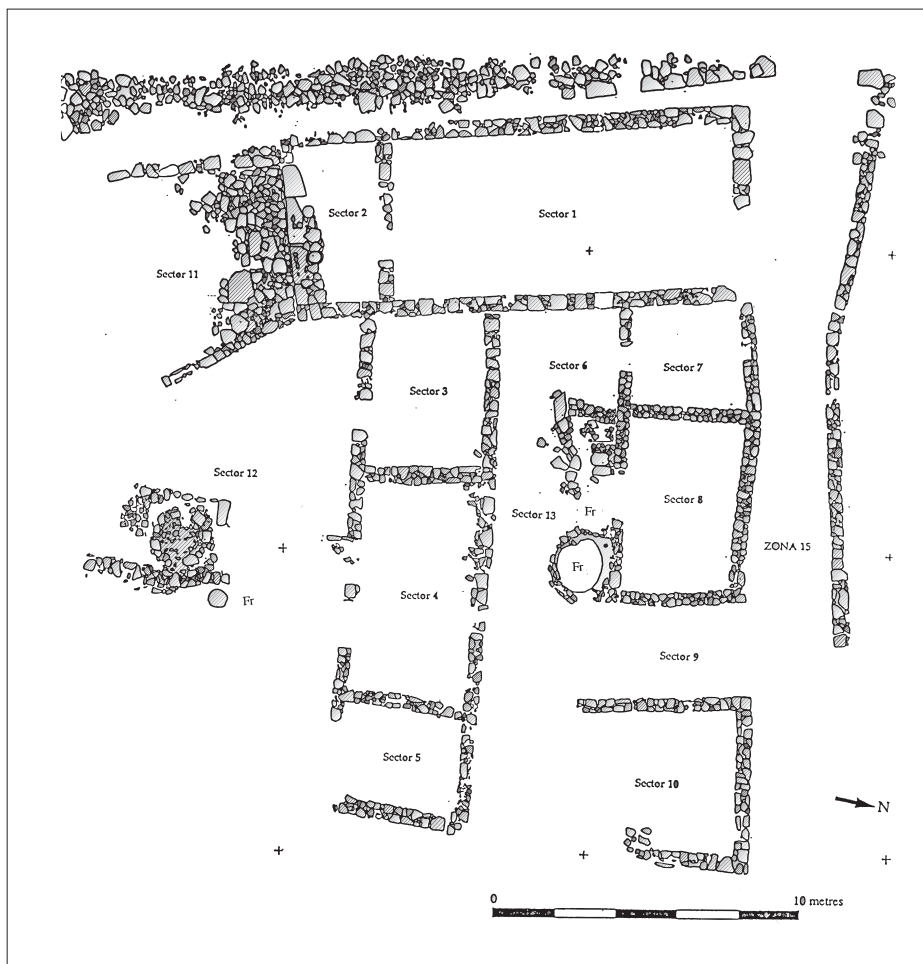
Figura 5. La zona 14, amb els sectors excavats

porta oberta en el parament de la muralla, al sud del sector 11, que caldrà veure en campanyes posteriors si correspon a una entrada al poblat o bé si es tracta d'un accés només a la zona 14. El que es veu clarament és que la seva obertura no va tallar la muralla en tota la seva alçada, sinó que es devia obrir en un moment posterior a la construcció d'aquesta, quan probablement les filades inferiors no eren visibles.