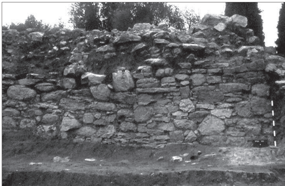
Figura 3. Detall del parament de la muralla vella