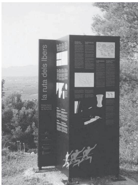
Figura 5. Detall del plafó d'informació general del Castellet de Banyoles, Tivissa (Ribera d'Ebre).

Per les seves característiques és possible atribuir a aquest recinte unes funcions de tipus estratègic basades en el control de la zona i alhora relacionades amb el comerç fluvial de l'Ebre.