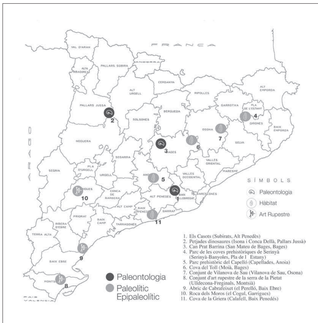
Mapa 1. Distribució dels jaciments museïtzats o en procés d'adequació per ser visitables a Catalunya: paleontologia i període paleolític-epipaleolític.