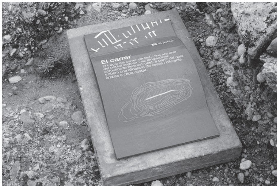
Figuras 3 i 4. Detall dels elements de senyalització del poblat del Puig Roig, Masroig (Priorat).