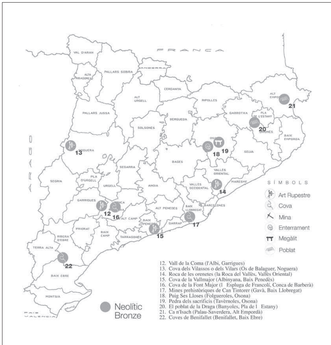
Mapa 2: període neolític-bronze.