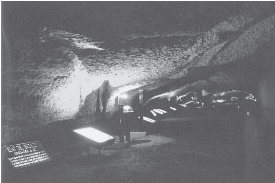
Figura 2. Detall de la cova de la Font Major, de l'Espluga de Francolí (Conca de Barberà).

Citem també altres indrets amb manifestacions artístiques d'època prehistòrica, en els termes municipals de Tivissa, l'Hospitalet de l'Infant, el Perelló, etc.