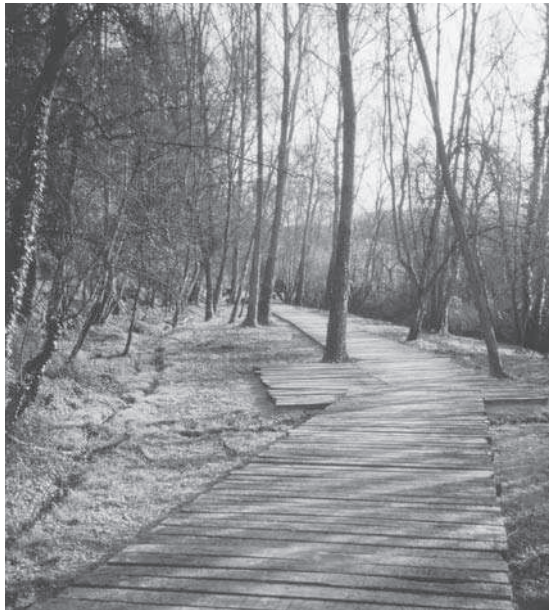
Figura 1. Vista del parc prehistòric de les Coves de Serinyà (Pla de l'Estany).