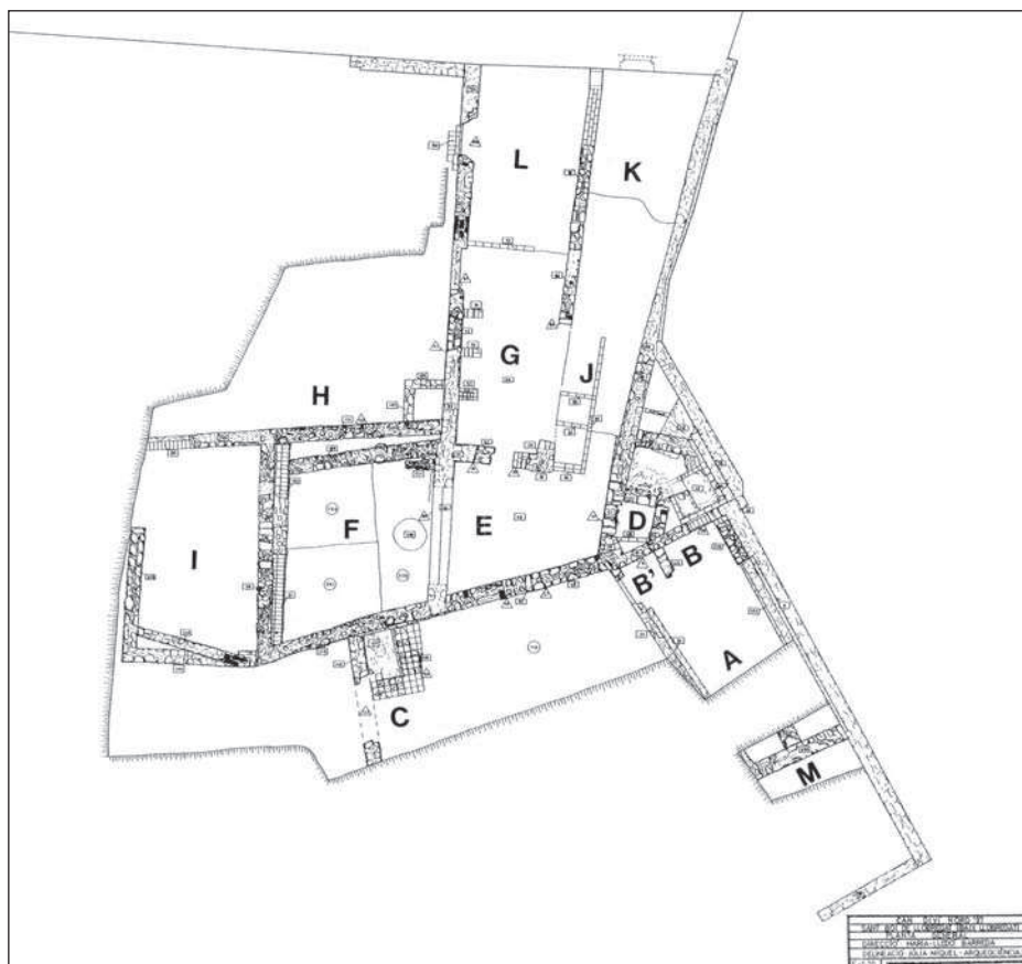
Figura 1. Planta general. Situació dels diferents àmbits.

butjats. Aquests abocaments es fan amb absència pràcticament total de materials arqueològics, per tant no es poden datar.