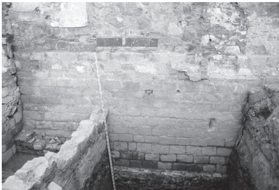
Figura 3. Muralla o clos? (Àmbits A-B).