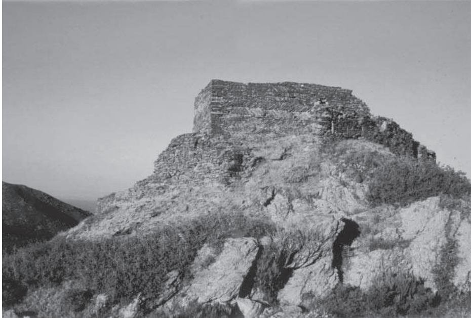
Figura 3. Castell de Bufalaranya vist des del NE.

veiem avui? Si estudis fets a castells construïts a la Catalunya Vella entre els segles VIII i XI contempen la possibilitat d'un reaprofitament d'antigues construccions entornades (Olèrdola: Fité 1993, 19; l'Esquerda, Osona: Ollich 1998), la localització al sector 6 dels tres murs de pedra seca, disposada fent filades d' opus spicatum , permet plantejar-se la possibilitat d'un primer establiment relacionat igualment amb funcions defensives i de control. Amb tot, la total inexistència de material arqueològic de qualsevol època amb relació a aquestes primeres estructures impedeix atribuir una cronologia sòlida per a aquesta fase inicial.