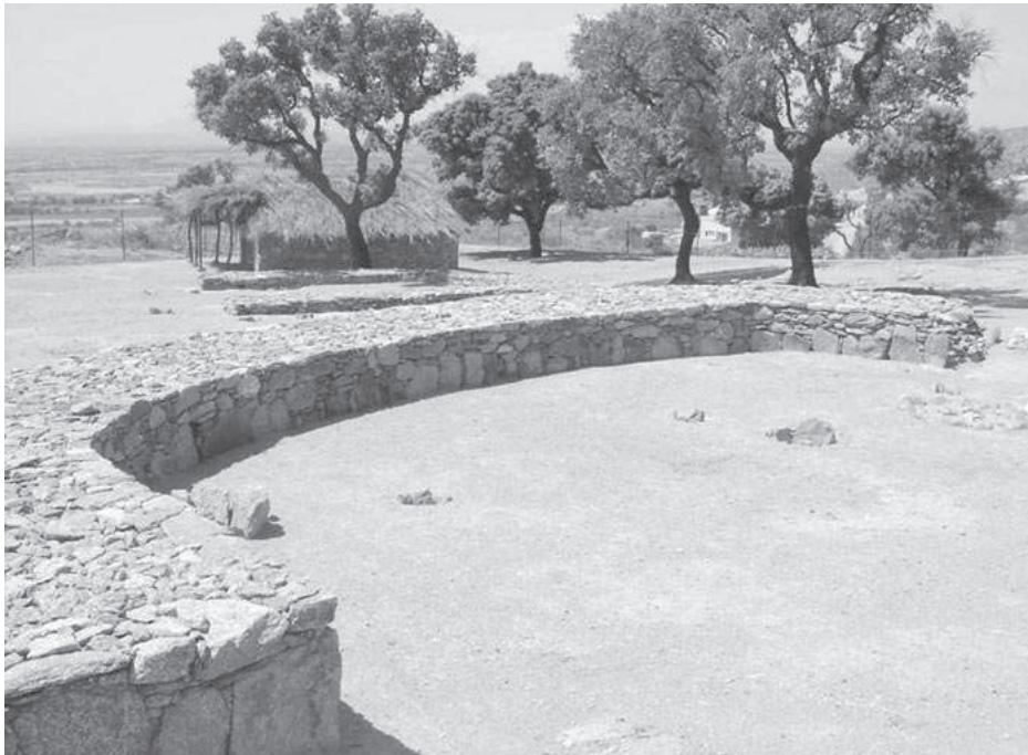
Figura 2. Vista general del poblat neolític de Ca n'Isach, l'any 2003.

Les tasques de restauració i adequació a la visita d'aquest jaciment neolític de Ca n'Isach es varen acabar a finals de maig del 2003. El divendres 27 de juny es va fer una primera presentació pública del poblat, adreçada especialment als arqueòlegs,