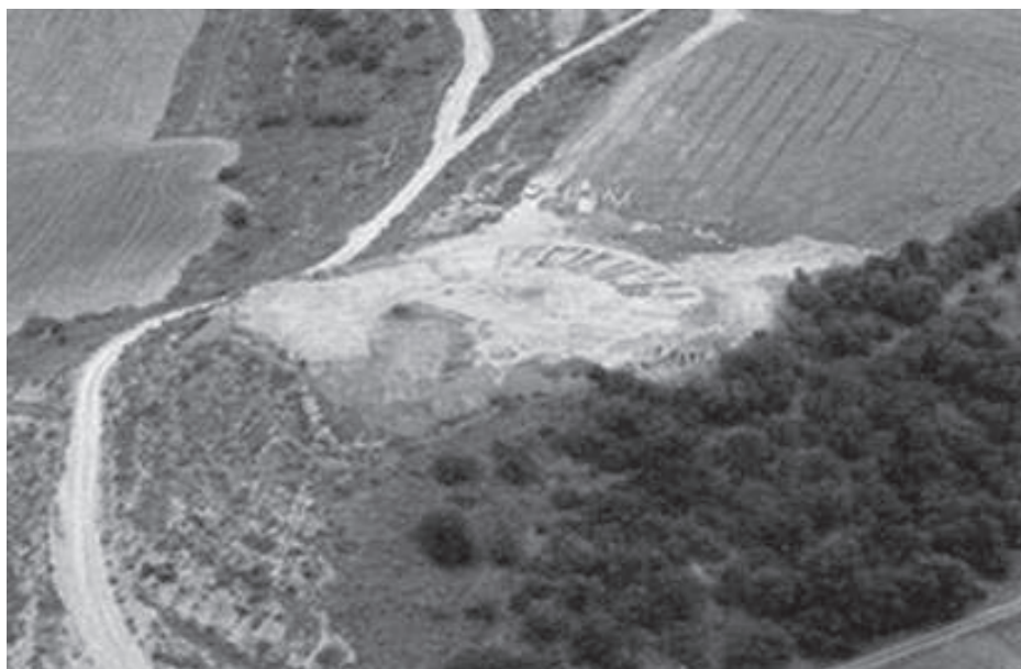
Figura 1. Vistes aèries.