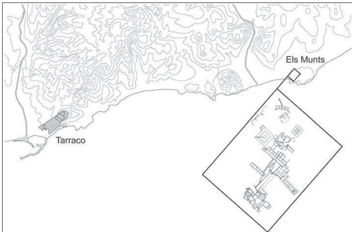
Figura 1. Plànol de situació en relació amb Tarraco (en el requadre, planta sinòptica de la vil·la).