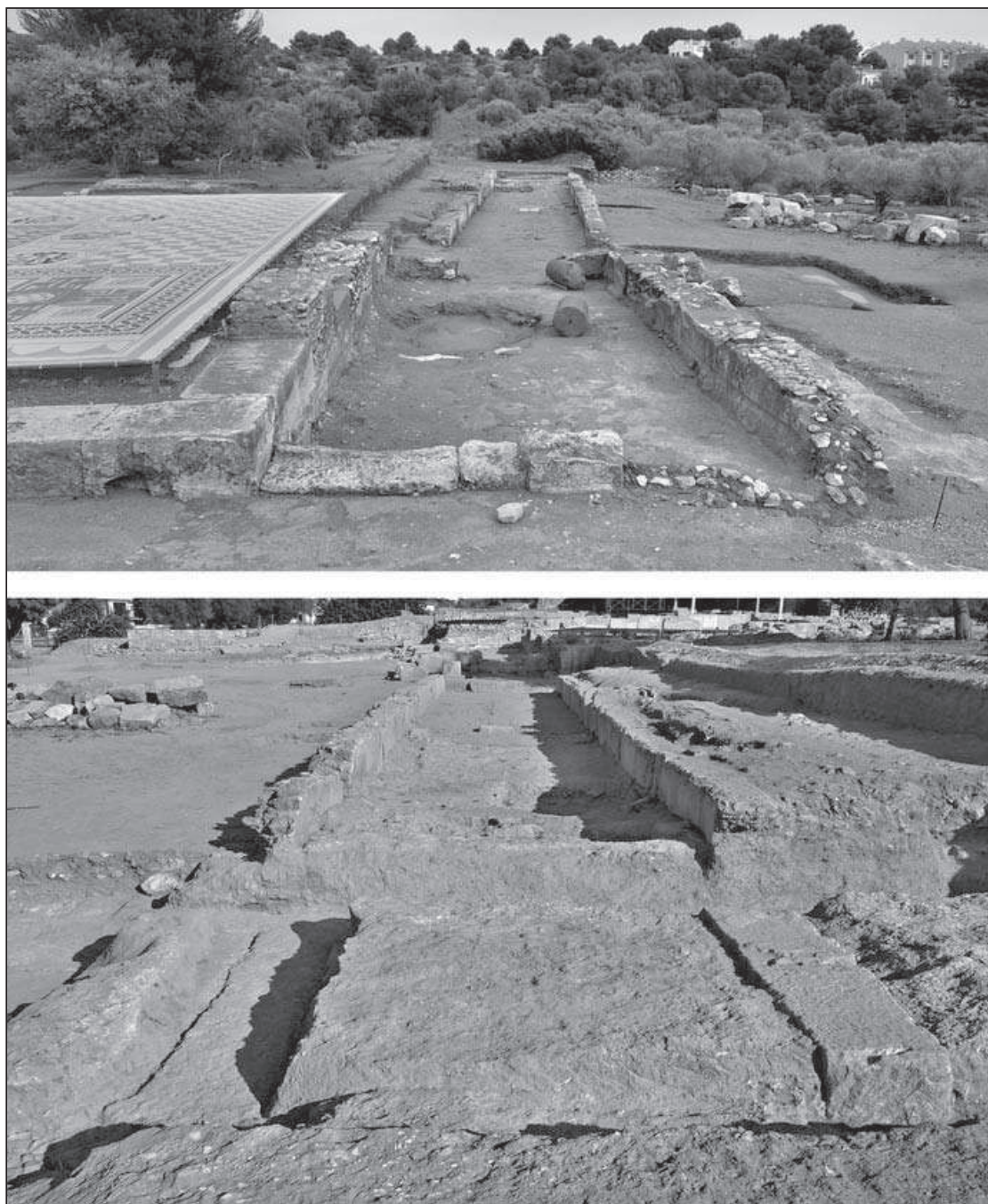
Figura 5. Vista del mitreu des del nordoest i des del sudest.

neació del pòrtic –que segueix l'ortogonalitat general de la vil·la– amb la del mitreu, lleugerament esbiaixada, ajustada probablement a una determinada posició solar. De fet, el pilar més oriental del pòrtic (ara corredor d'accés al mitreu) queda integrat a l'interior de la pronaos per la construcció del mur occidental de tancament, en el qual s'obre una porta. En un moment posterior (dins del segle III), els restants espais entre pilars es van clausurar tancant, almenys parcialment, el corredor d'accés. Els espais que precedeixen la gruta, comunicats a través de portes amb escales, fan que aquesta quedi semisoterrada, aïllada en un cosmos propi i amagada als ulls dels no iniciats.