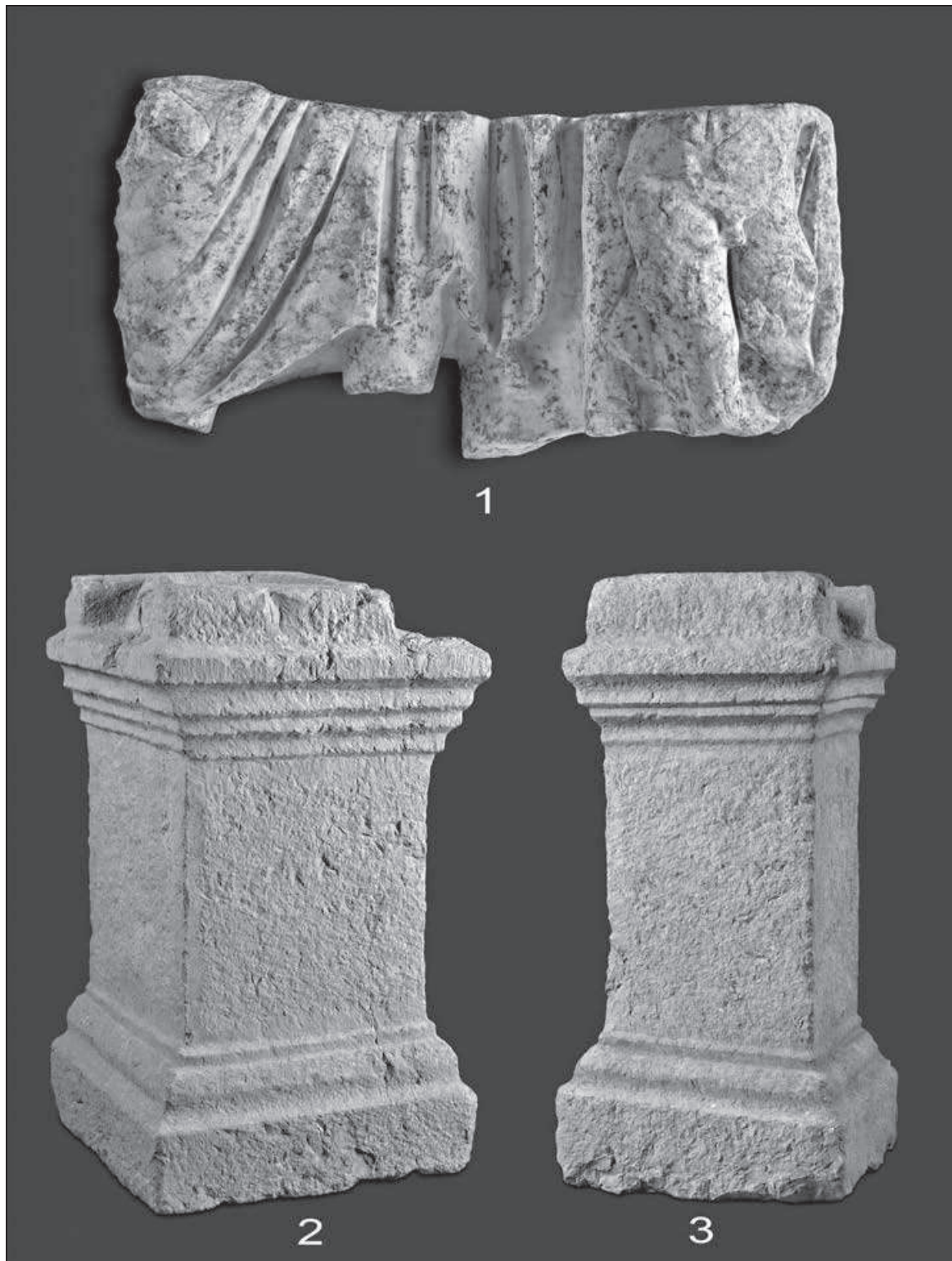
Figura 6. 1. Fragment de grup escultòric (MNAT EM-04-2604-2), 2. Ara anepígrafa (MNAT EM-04-2262), 3. Ara anepígrafa (MNAT EM-04-2613-1).