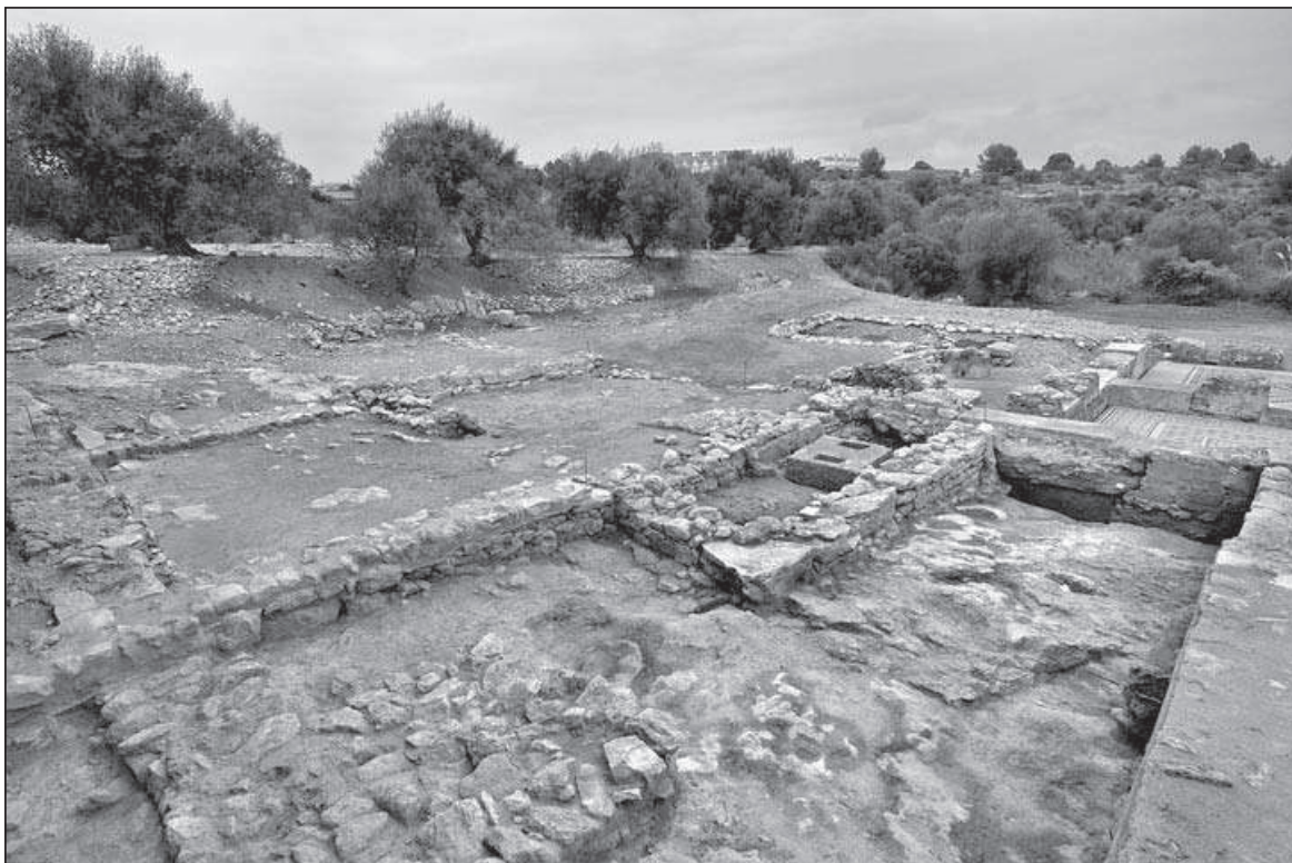
Figura 3. Vista des de l'oest de les premses de la vil·la del segle I dC documentades sota el corredor del braç nord de l'ambulatí.

Al nord, a l'oest i al sud d'aquestes evidències de la vil·la inicial es documenta la presència de murs caracteritzats per una tècnica constructiva similar: pedres irregulars lligades amb argila i l'ús esporàdic del morter de calç (en les estructures de caràcter hidràulic). Prenent com a indicatiu aquesta caracterització i –allí on és possible– l'evidència estratigràfica, es pot intuir una edificació de grans dimensions que s'estén des de la plataforma superior fins al posterior emplaçament dels banys meridionals de la vil·la del segle II. Les estructures i els àmbits atribuïts a aquest edifici tenen una funció de caràcter bàsicament productiu (premses, dipòsit i àrea d'emmagatzematge). De la pars urbana , que probablement s'estenia per la plataforma superior, procedirien els fragments de pintura mural recuperats en els nivells d'amortització de les premses que regularitzen l'espai per a la construcció de la vil·la d'inicis del segle II. Un model de vil·la orientada a la producció derivada de l'explotació de les terres de conreu de l'entorn, afavorida per la seva situació estratègica, entre la via Augusta i la costa. Convé assenyalar que aquest període coincideix amb el moment de màxima producció i difusió dels contenidors amfòrics destinats a l'exportació del vi tarraconense, principalment les formes Pascual 1 i Dressel 2-4