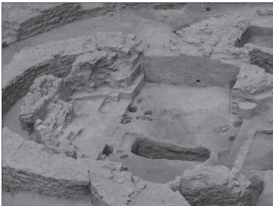
Figura 5. Vista aèria de les restes de la cripta (segle XII)