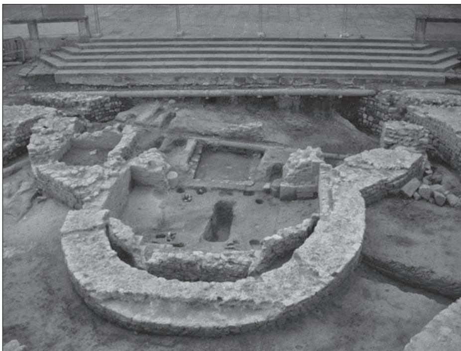
Figura 4. Vista aèria de les restes de l'església del segle XI

església també de planta circular. La intervenció arqueològica deixa fora de dubte l'afectació que patí l'estructura del segle XI, a causa de l'aixecament del nou edifici. La planimetria de les restes ens mostra clarament que l'església d'Oliba fou arrasada fins als nivells necessaris per a la construcció del nou temple i que part de les estructures que la conformaven foren destruïdes durant la construcció dels nous murs. La demolició devia representar una desaparició total de l'antic conjunt i únicament es produí, com veurem més endavant, la construcció d'una cripta dins l'espai on se situava l'absis semi-circular del segle XI.