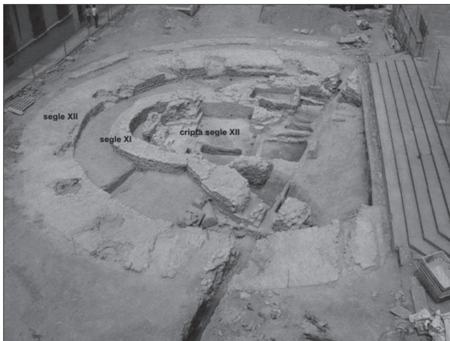
Figura 1. Santa Maria la Rodona. Vista aèria de les restes. Les esglésies dels segles XI i XII.

Podem afirmar que l'àrea excavada ha posat al descobert l'existència de dues construccions clarament diferenciades que s'han de relacionar amb les successives reconstruccions: l'església del segle XI (bastida el 1038 pel bisbe Oliba) i l'església del segle XII (aixecada de nova planta entre 1141 i 1180), que perdurà fins a l'any 1787, quan fou enderrocada. En aquest cas, la contrastació dels resultats arqueològics amb les fonts documentals permeten corroborar l'existència i la cronologia d'ambdós edificis.