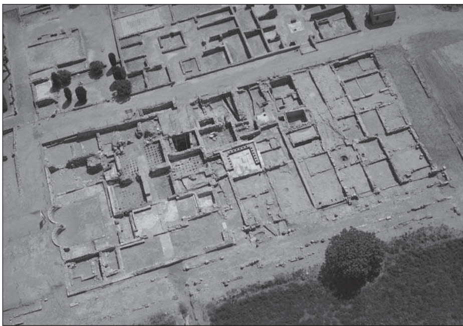
Figura 2. Vista aèria general de les estructures excavades a la Insula 30 entre 2000 i 2005.

almenys, algunes de les sales termals es mantenen encara en ús i varen ser objecte de diverses reformes i modificacions tardanes. Cal tenir en compte, però, que una gran part de les restes arquitectòniques conservades i l'estructura general que ara mostra l'edifici, responen a una important fase constructiva que hem de situar en la primera meitat del segle II dC, període durant el qual el conjunt de les termes públiques assolix la seva màxima extensió i complexitat.