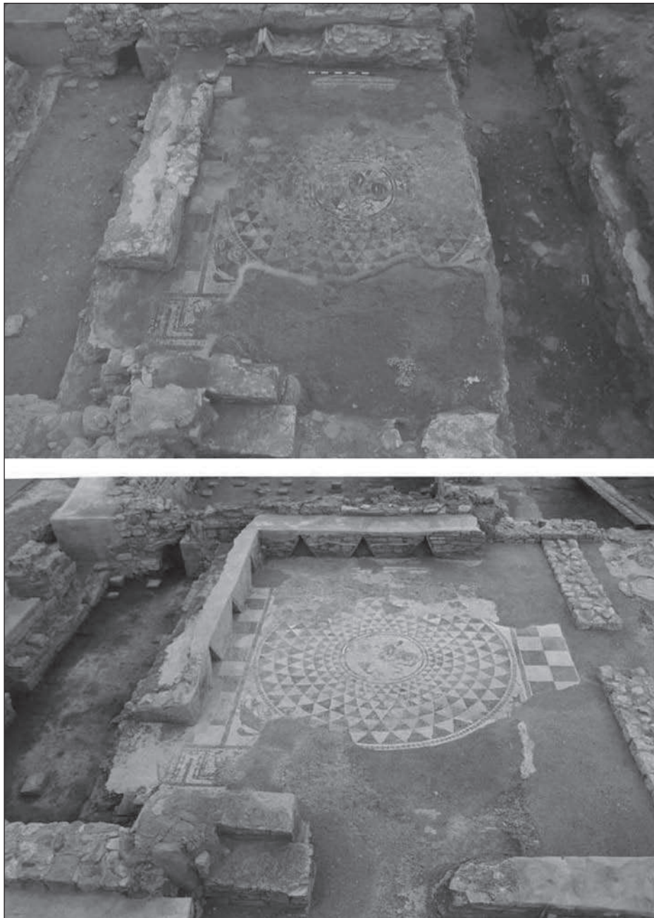
Figura 4. Paviment de mosaic que decorava l'apoditeri de les termes, abans i després de la restauració efectuada amb el patrocini de la Fundació Elsa Peretti.