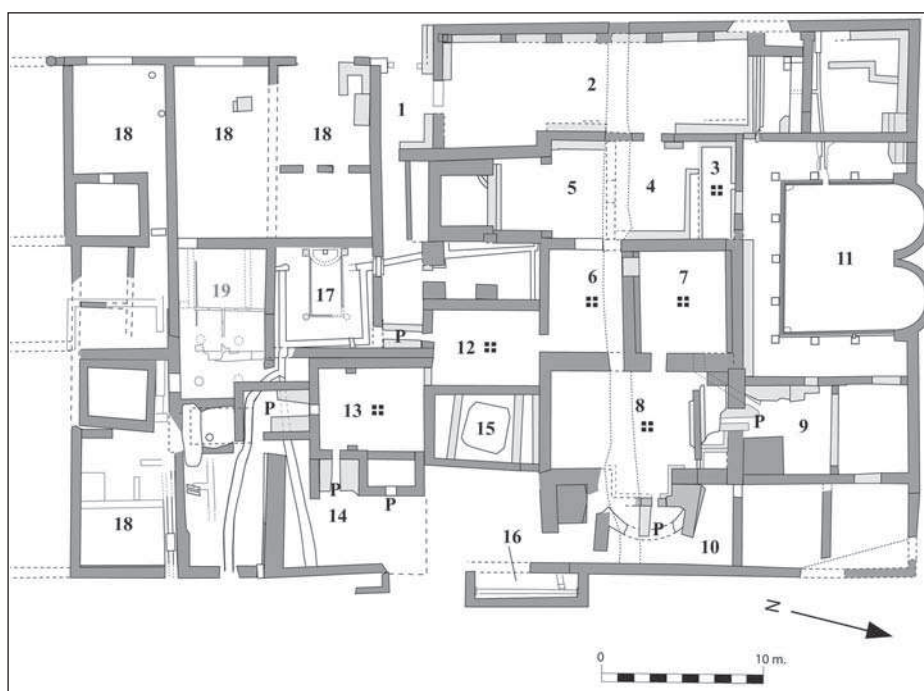
Figura 3. Planta parcial de la Insula 30, que inclou totes les estructures de les termes, així com algunes de les tabernae situades immediatament al sud.

Les posteriors modificacions dutes a terme a l'edifici durant el segle II dC alteraren de forma significativa la seva estructura interna. Aquesta va esdevenir un xic més complexa i articulada (Figura 2 i 3), amb la inclusió de noves sales i instal·lacions adequades a les noves exigències de la pràctica termal romana, seguint un procés de transformació arquitectònica similar a la de molts altres conjunts termals urbans d'aquest període (AQUILUÉ et alii , 2002a).