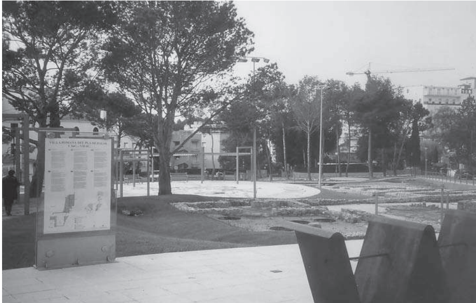
Figura 3. Detall de la vil·la del Pla de Palol (Platja d'Aro, Baix Empordà).