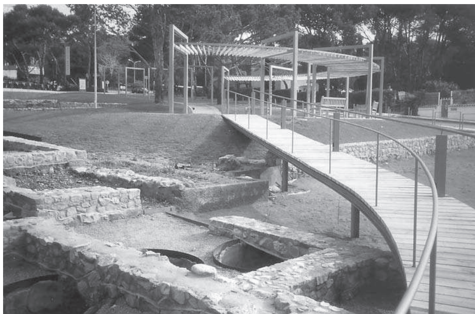
Figura 4. Detall de la villa del Pla de Palol (Platja d'Aro, Baix Empordà)