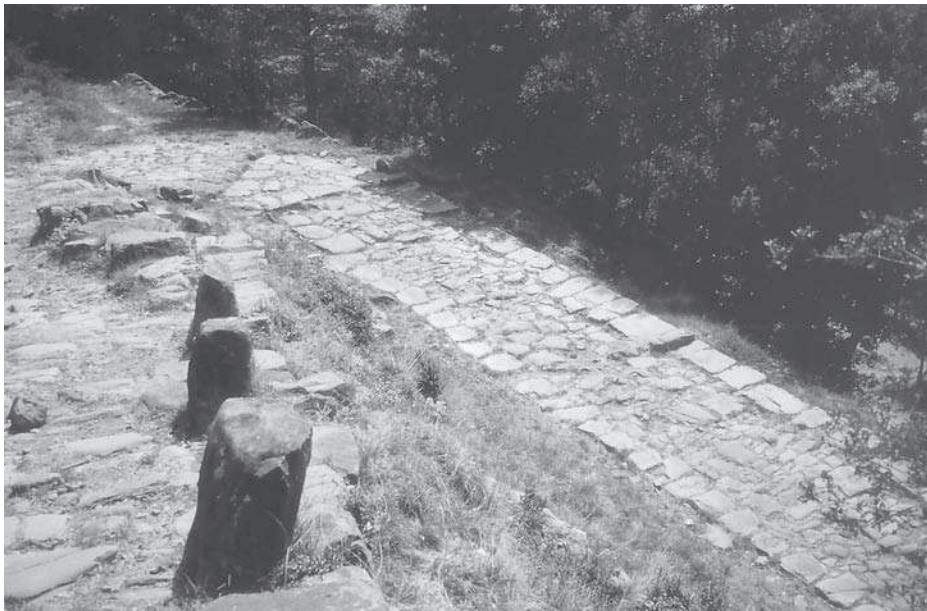
Figura 7. Via de Capsacosta (Sant Pau de Segúries/Vall de Bianya, Ripollès/Garrotxa)