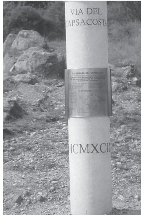
Figura 6. Detall de l'element de senyalització de la via romana de Capsacosta (Sant Pau de Segúries/Vall de Bianya, Ripollès/Garrotxa)