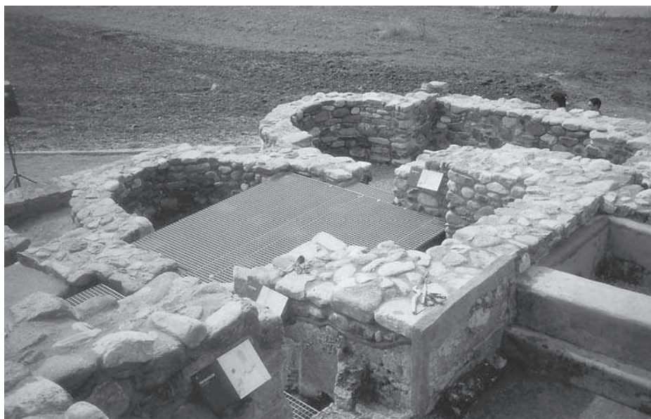
Figura 2. Detall de la vil·la de Can Terrés (la Garriga, Vallès Oriental).