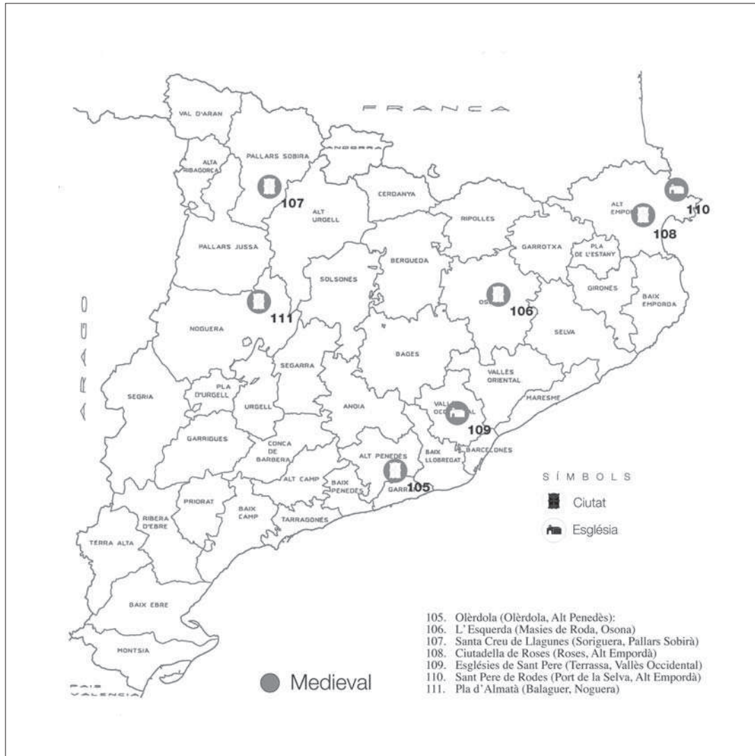
Figura 8. Situació dels jaciments principals de l'època medieval que avui són visitables o ho seran molt aviat, esmentats en el text.