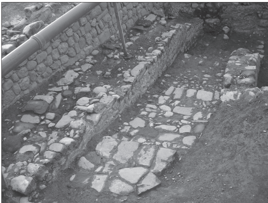
Figura 5. Imatge del carrer adossat al mur de façana de la sinagoga i de les escales d'accés al Portal dels Jueus.