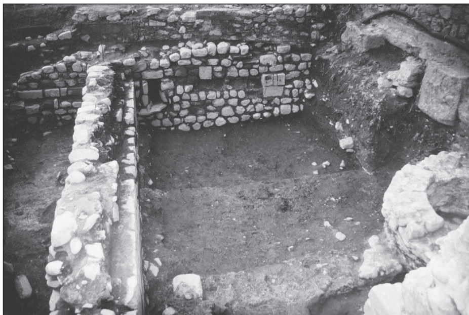
Figura 11. Restes de la sala d'oració de la sinagoga medieval.

Entre les restes de l'enderroc dels immobles de l'entorn de la plaça, es van trobar restes de metralla de bomba i elements constructius i decoratius (com capitells, restes de finestres...).