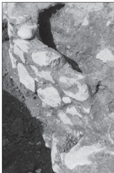
Figura 9. Restes d'una canal situada a mig del pati de la sinagoga.

Les obertures de la galeria cap a la sala estaven cobertes amb algun tipus de gelosia de fusta per evitar la distracció dels homes durant l'oració.