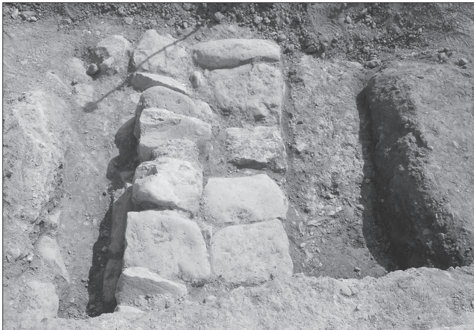
Figura 12. Mur anterior a la construcció de la sinagoga, localitzat a la zona del pati corresponent a la fase 2.

Amb el pas dels segles també canvia la funció de l'edifici; així, a principis del segle XVII (1601), tant la sala d'oració com el pati s'utilitzaven per a pràctiques relacionades amb la indústria del tèxtil. Durant els treballs d'adequació per a la museïtzació de les restes de la sinagoga es va fer necessari eliminar les estructures corresponents a les edificacions dels segles XIX i XX: sota aquests elements van aparèixer les restes d'una mena de dipòsits, dos dels quals, trobats a la zona del pati, només conservaven els fonaments. A la primera campanya d'excavacions, l'any 2002 havia aparegut un altre dipòsit. Els tres elements devien estar relacionats amb les activitats tèxtils que es devien fer a l'edifici en aquest període (Fig. 12).