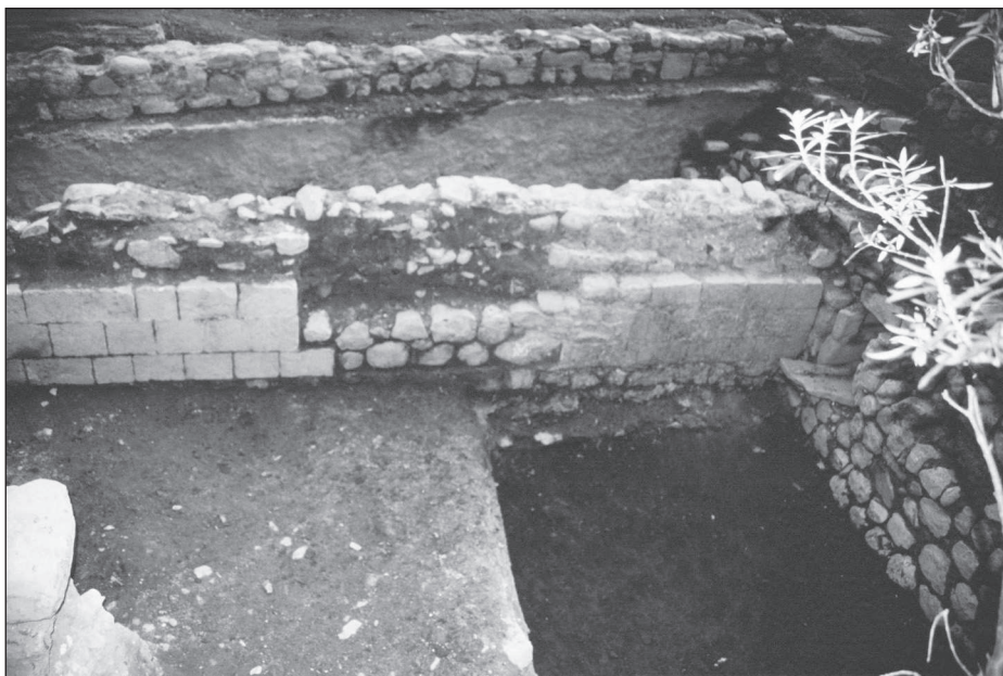
Figura 10. Imatge de la porta de ponent de la sala d'oració.

En el cas de Besalú, l'ús en principi al qual és destinada la sinagoga després de l'abandonament és la de presó, arxiu i seu del consell municipal.