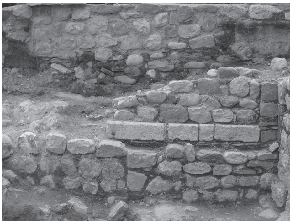
Figura 6. Imatge interior de la porta principal d'accés al pati de la sinagoga.

La superfície del pati, no devia presentar cap tipus de cobertura ja que la sala d'oració necessita l'entrada de llum natural per a l'oració. La construcció d'una habitació en aquesta zona no hauria permès el pas de la llum, aquesta hipòtesi es reforça en el fet que totes les sinagogues han de tenir un seguit de finestres, perquè el Talmud prohibeix