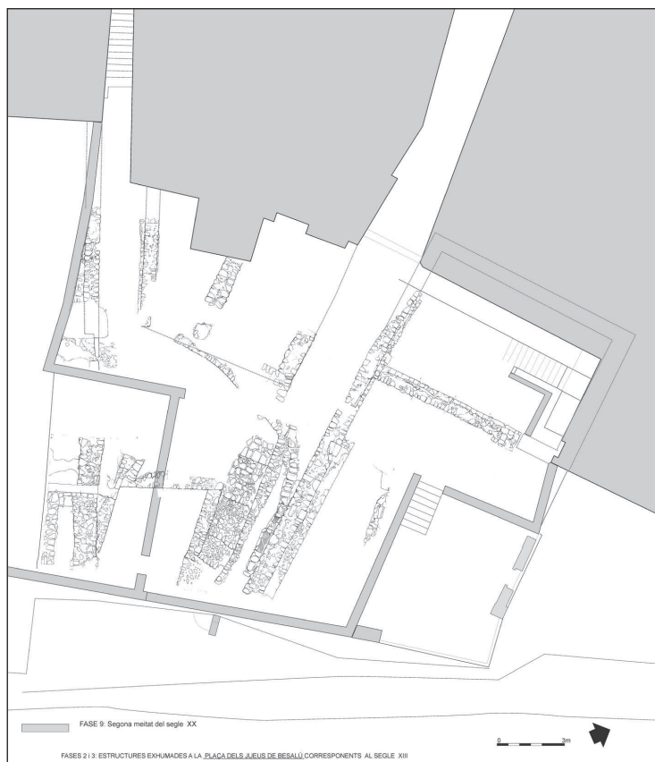
Figura 3. Planta de les estructures corresponents a les fases II i III