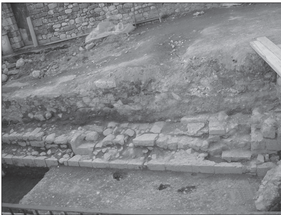
Figura 7. Imatge del banc corregut situat al pati adossat al mur interior de la façana de la sinagoga.

Dels dos elements fonamentals de la sala d'oració —l'arca que conté els rotlles de la llei (Araón-ha-qodeix) i la tarima per a la lectura (Bimàh)— no se'n conserva cap resta, perquè el paviment original de la sala va ser espoliat a finals del segle xv. Per tant, la localització d'aquests elements dins la sala seria una mera suposició.