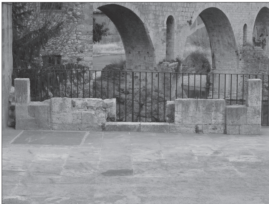
Figura 8. Mur de l'habitació de l'escola.

Es va localitzar una segona porta situada a l'est del mur de separació amb el pati, per on s'accedia a un petit replà que devia connectar amb les escales del micvé.