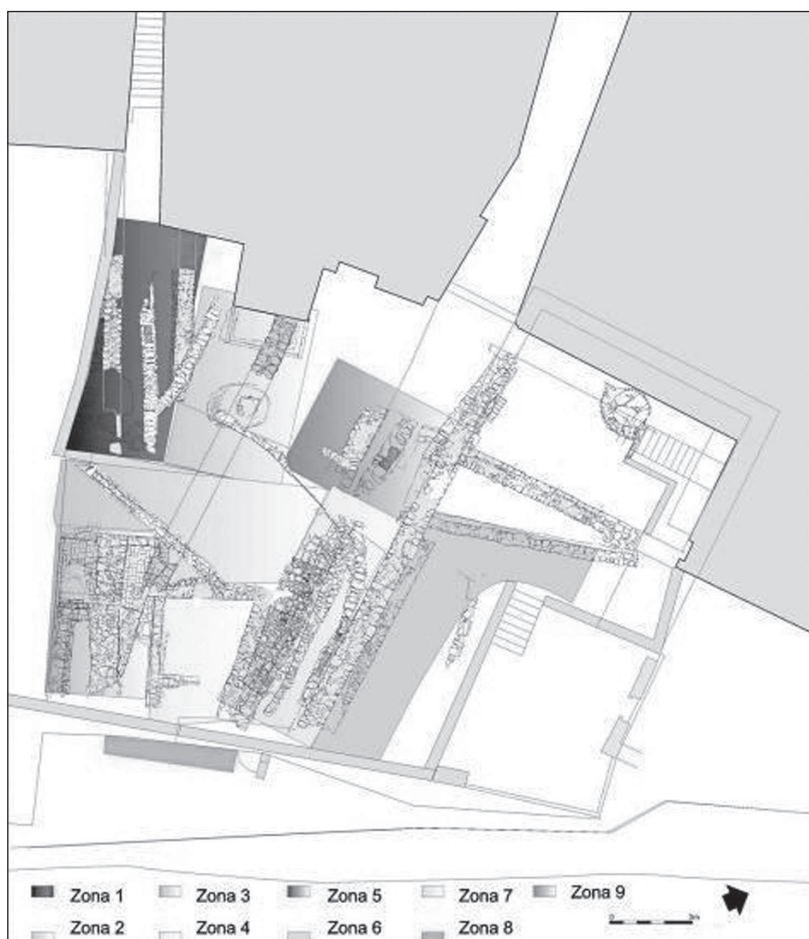
Figura 2. Planta de les restes exhumades a la plaça dels Jueus des de l'any 2002 al 2006.

Les intervencions arqueològiques, entre els anys 2002 i 2006, han permès determinar l'evolució urbanística de la plaça concretades en nou fases d'intervenció des del període comprés entre el segle I dC fins a l'actualitat.