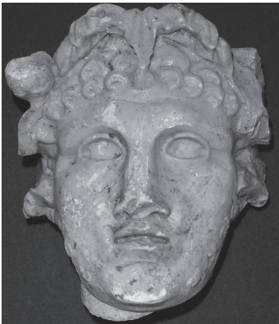
Figura 1. Imatge de la testa del déu Baco trobada Granollers

Història Natural. Aquestes peces solien realitzar-se al costat de la mateixa pedrera i posteriorment eren exportades directament des de la zona africana pel Mediterrani o bé mitjançant comerç via Roma. 3