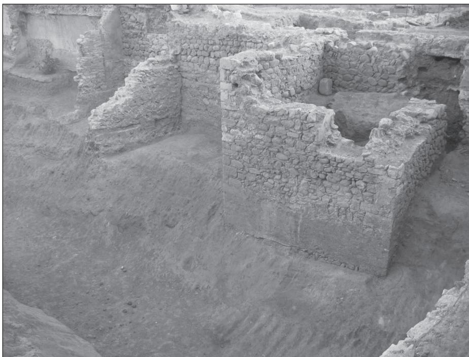
Figura 2. Foto de la bestorre localitzada al solar C2.

La bestorre localitzada en el solar C2 de Granollers, com a tal, no té el costat interior tancat, és a dir, es compon només de tres parets. Aquesta tècnica poliorcètica aconseguia que en cas d'atac i de que la bestorre sigui apressada per l'enemic, aquesta no pugui ser utilitzada per atacar l'interior de la ciutat. La bestorre documentada presenta un factura similar a les trobades anteriorment. Quant a la planta, quadrada, té 4 metres de costat. Pel que respecta al parament, està construït a partir de carreus ben desbastats i pedra de construcció de mòdul rectangular, amb inclusió d'alguna llosa i creant filades ben alineades i horitzontals. Les cantonades són reforçades a partir de l'alternança de carreus disposats de cap i través. Els murs estan construïts sobre una banqueta de pedra de construcció amb carreuada rústega, de mòdul rectangular i sense mesures definides. El morter és, ocularment, molt similar al de la muralla.