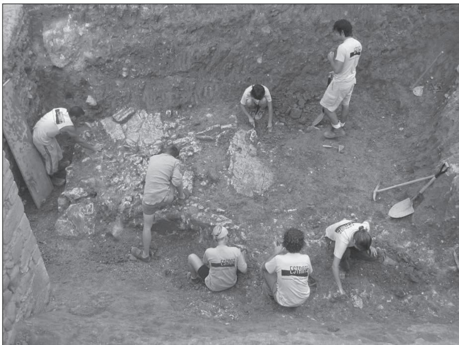
Figura 3. Foto del fossat durant les tasques d'excavació.

Tots els trams de fossat excavats presenten unes característiques similars, tant en la seva morfologia com en la seva amortització, a excepció del tram de fossat excavat al solar dels Lledoners, on es va documentar un pany de muralla abocat entre l'amortització del fossat. En cap dels cassos s'ha documentat cap indici en el fossat que faci pensar en la possibilitat de trobar-nos davant d'un accés a la ciutat.