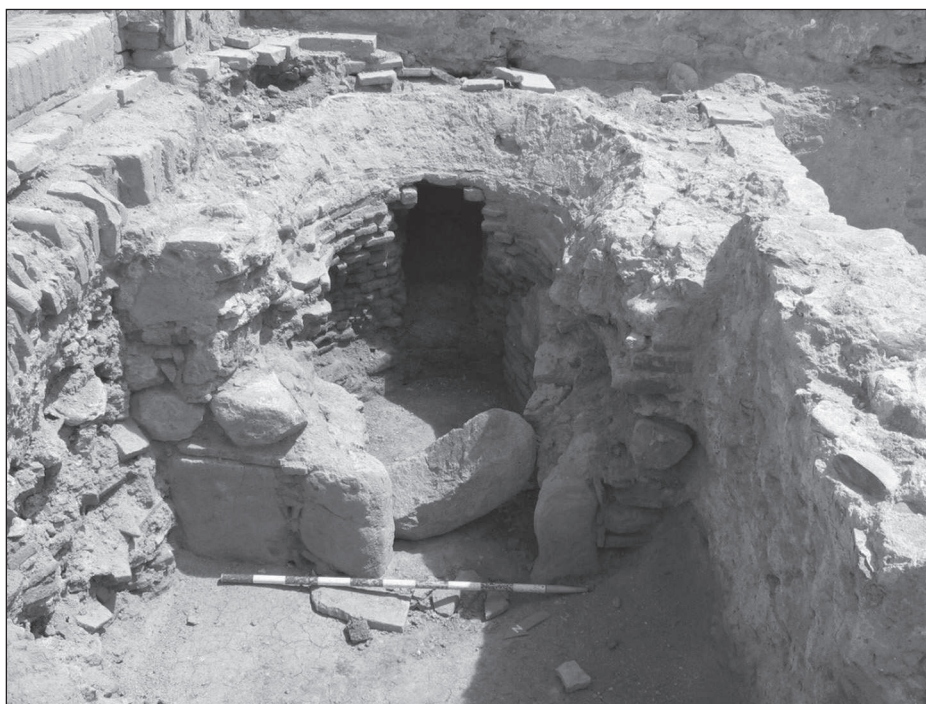
Figura 4. Imatge del fogó

Cal destacar, a l'adoberia de Can Ginebreda, la presència d'una estructura de combustió. Concretament es tracta d'un fogó d'obra i, encara que no és estrany trobar-ne, tampoc podem dir que sigui un element present a totes les adoberies. Val a dir que dels dos exemples d'adoberies més coneguts a Catalunya, Cal Granotes a Igualada i l'adoberia de Tàrrega, només en el cas de l'adoberia de Tàrrega es documenta aquesta estructura de combustió (ENRICH, J., 2002). En el cas de Can Ginebreda, el fogó es troba en un estat de conservació força bo. Es situa a la cantonada nord-est de l'edifici, en un espai semisoterrani. És bastit amb còdol lligat amb morter de calç i amb material constructiu ceràmic, sobretot a la part corresponent a la cambra de combustió. La funció d'aquest fogó seria la d'escalfar aigua per accelerar els processos d'adobatge, així com preparar diferents solucions o substàncies que milloressin la qualitat de les pells que s'hi tractaven. Com hem comentat anteriorment, aquest tipus d'estructura és habitual a les adoberies, però també és molt comú en altres tipus de complexos preindustrials, com la que es va poder documentar a la saboneria de Santa Maria de Palautordera, molt similar a la de Can Ginebreda quant a tipologia, però amb unes funcions relacionades amb la producció de sabó (SALVADÓ, I. et al. , 2005).