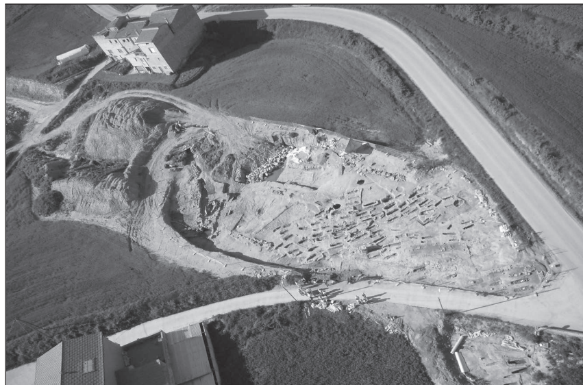
Figura 2. Vist parcial del jaciment anomenat Accés Casserres Est (entorn de Sant Salvi).

Dins la zona de necròpolis també s'ha documentat un canal per reconduir les aigües d'un antic torrent, un dipòsit i altres construccions que podrien correspondre amb una zona de pastera i decantació d'argiles, que funcionaria amb el forn de material d'obra localitzat a escassa distància de la zona de treball i al costat del canal. La datació del forn mitjançant un estudi arqueomagnètic ha donat una cronologia per el seu abandonament àmplia però significativa, entre el 117 i el 401 d.n.e., moment en que apareixen les primeres tombes de la necròpolis.