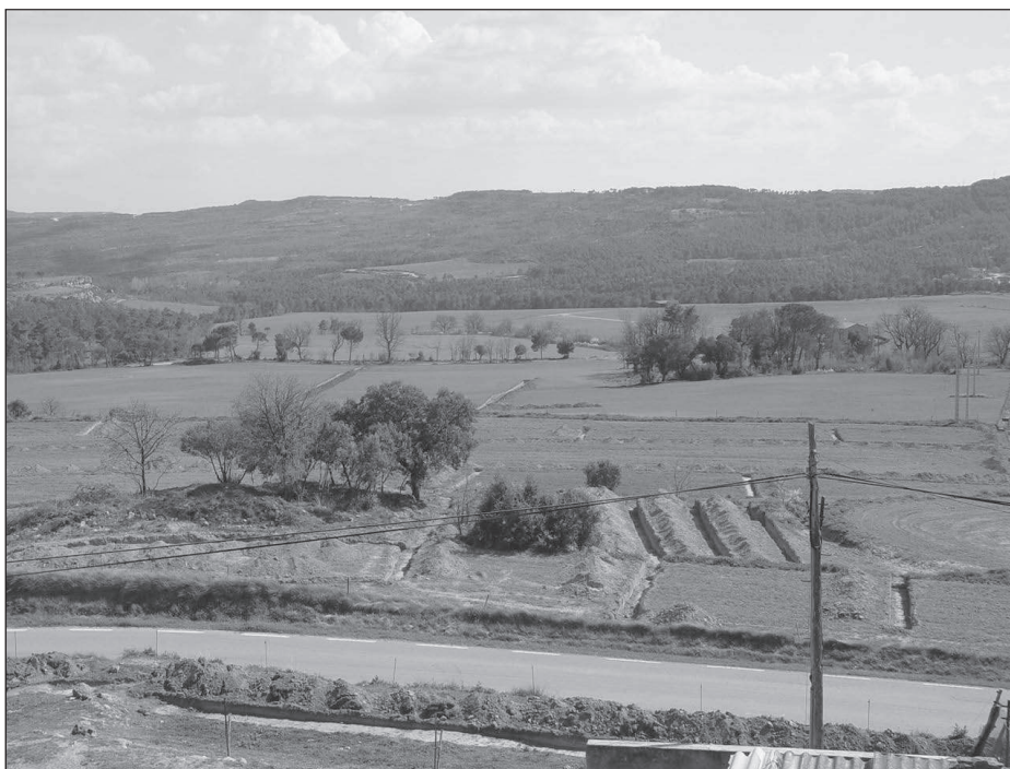
Figura 4. Vista parcial dels camps que ocupa el jaciment de St. Pere de Casserres des de la terrassa superior.

La cinquena zona consisteix en una extensa àrea d'emmagatzematge amb un considerable nombre de sitges, limitat pel cantó sud i est per el camí de Cal Sargantana i per l'oest per un torrent. Cap de les sitges detectades fou excavada, ja que es tractava de delimitar el jaciment en extensió.