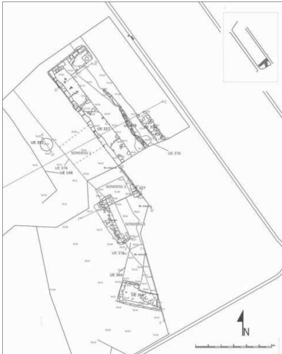
Figura 5. Planta de la Torre Grossa, una torre poligonal emplaçada en una cantonada de la muralla, al costat de la via de comunicació principal. Autor: O. Varas