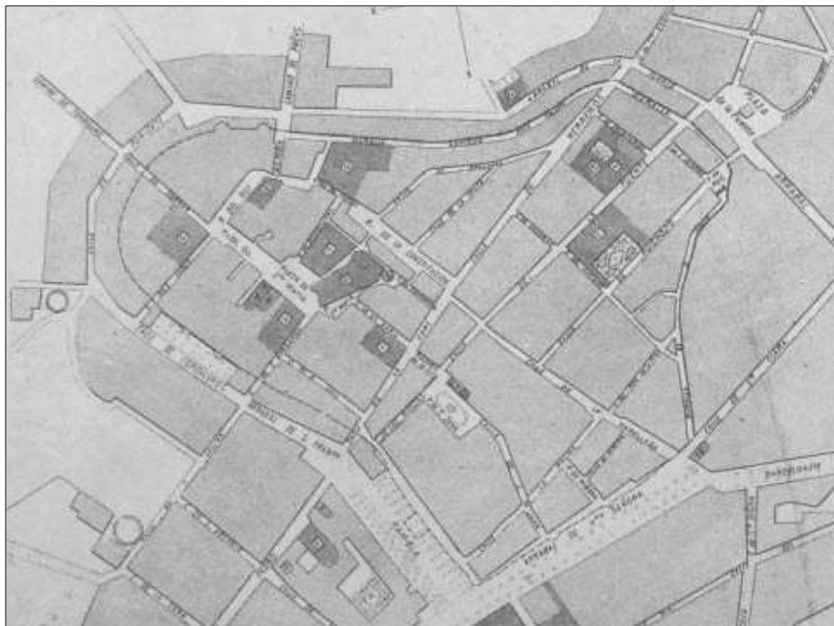
Figura 3. Extracte del “Croquis topogràfic” [sic.] de Vilafranca del Penedès de l’any 1872. L’autor hi grafia el traçat de la muralla i la situació d’algunes torres. Arxiu dels Serveis Tècnics de l’Ajuntament de Vilafranca del Penedès

En el cas de les dues torres quadrades que el mapa situa als carrers d’Hermenegild Clascar i del General Prim, els treballs arqueològics han constatat la seva presència. En canvi pel que fa a les dues torres semicirculars al començament del carrer de Ponent, cap de les intervencions efectuades n’han verificat l’existència. Si bé és cert que, en el moment de fer el mapa, el tram de muralla del carrer Hermenegild Clascar encara estava a la vista, es desconeix a partir de quina font l’autor en va situar el traçat de la muralla i la situació de les torres.