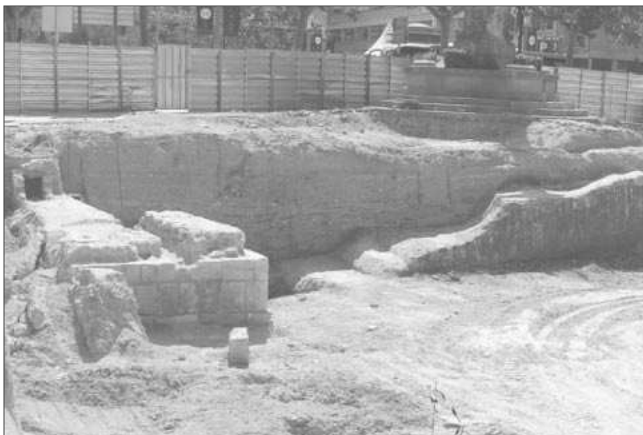
Figura 8. Fotografia de la Torregrossa i el fossat associat.

La segona fase devia funcionar amb la Torregrossa, que dóna una cara vista vers el fossat, entre el segle XV i el segle XVII. Aquest fossat té fins a 9 m d'amplada i una profunditat de més de 2 m, encara que podria ser superior com abans s'ha comentat. Durant la intervenció va aparèixer un esglaó inicial a 5 m de la base de la torre i un segon esglaó a 8 m. Així doncs, el fossat s'amplia en aquesta zona, deixa un gran espai al voltant de la Torregrossa i canvia l'orientació.