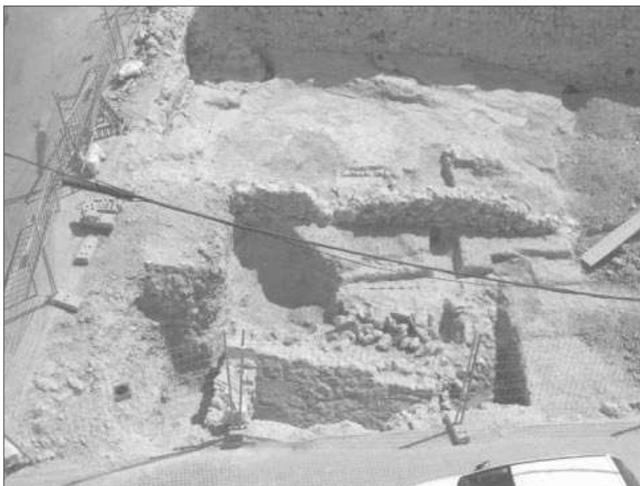
Figura 7. Fotografia de l'escarpa (en primer terme) del carrer Ponent, 1. Autor: O. Varas

Arqueològicament la primera intervenció on es va poder observar aquestes defenses exteriors de la Vilafranca medieval i moderna va ser la que es va fer al carrer Ponent, 1, l'any 2007. Aquesta intervenció preventiva se situa a la part nord de l'antic nucli de la vila, en el solar que feia cantonada entre els carrers de Ponent i de Sant Pau. Aquest solar era a tocar d'un dels possibles portals, el d'en Coloma, pròxim al castell dels Castlans.