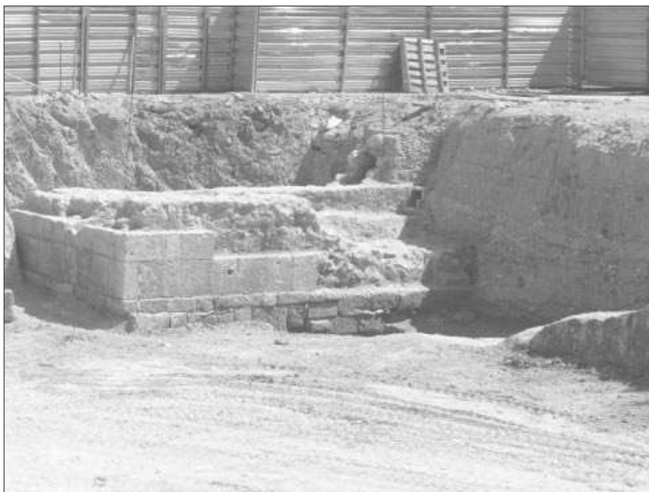
Figura 6. Fotografia de l'alçat de la Torregrossa. Autor: O. Varas