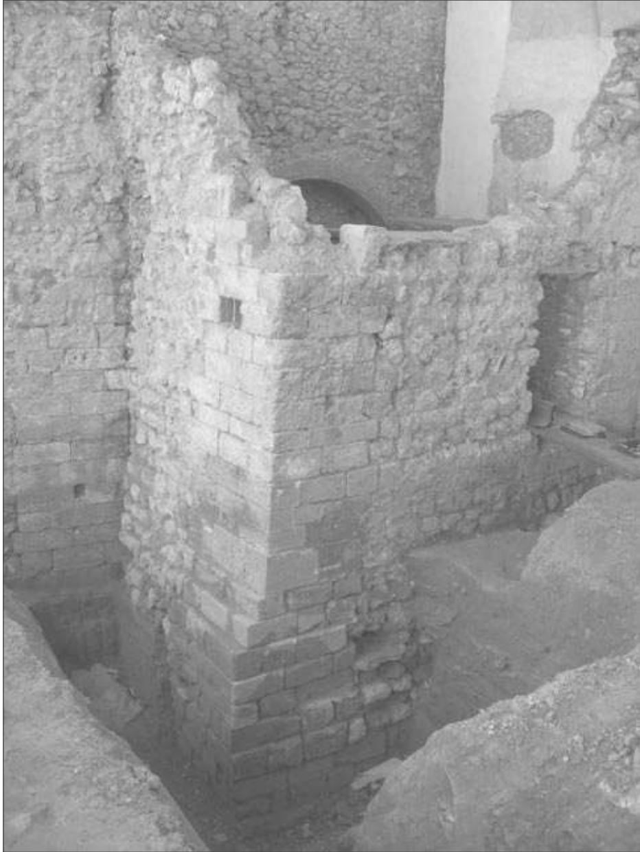
Figura 4. Fotografia de la torre de planta quadrada d'Hermenegild Clascar, 16-22. Autor: J. Amorós