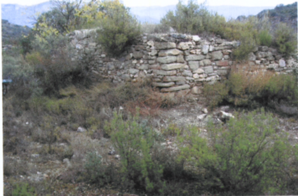
Vista de la cabana en la que es trobava la pedra