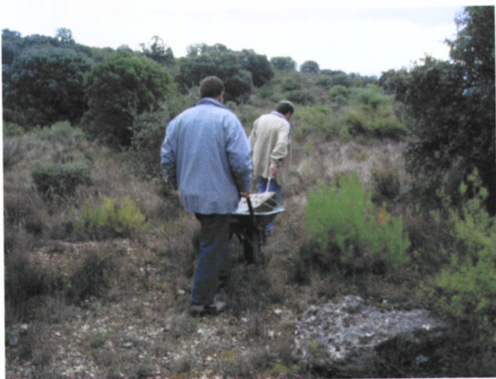
Trasllat de la pedra fins al vehicle