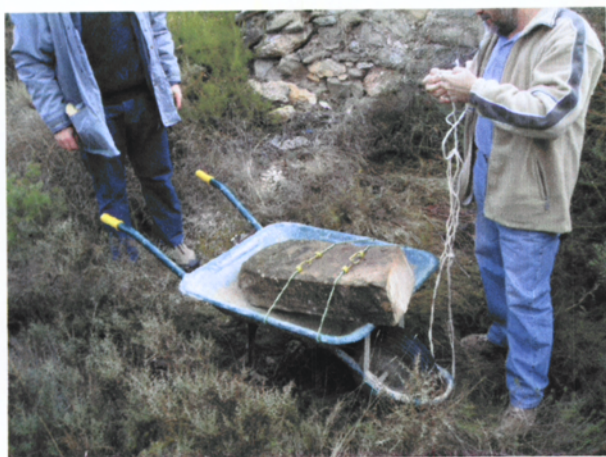
Fixació de la pedra per al seu trasllat