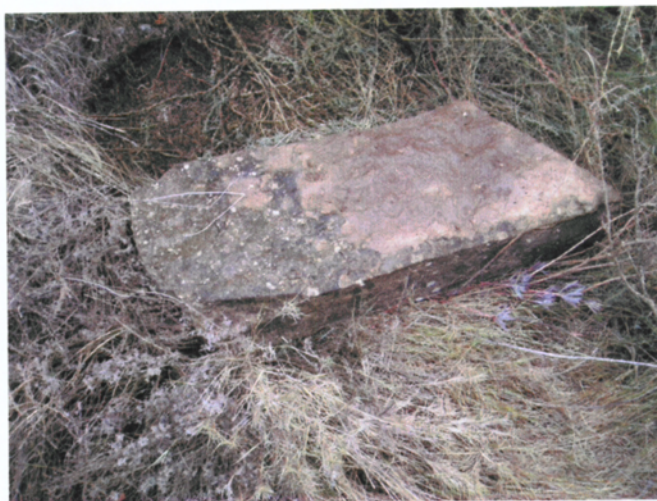
Detall del bloc en el punt de partida del trasllat