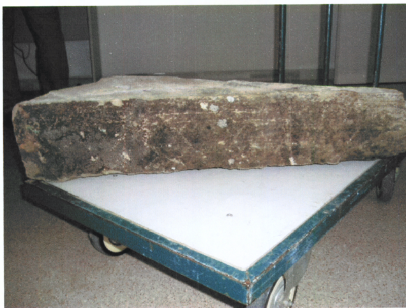
Detall de la cara del bloc en la que es localitzen els signes inscrits