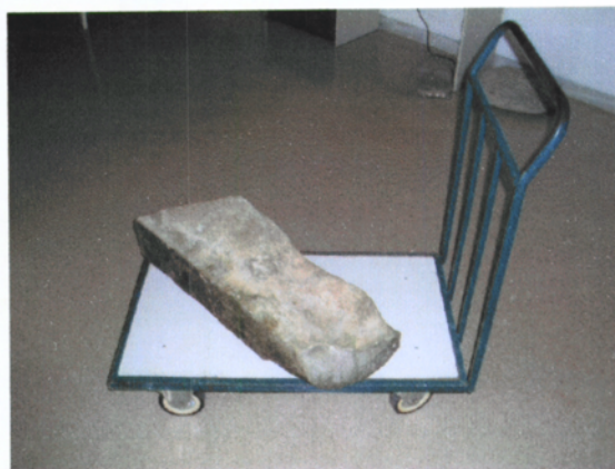
Vista del bloc un cop arribat al Museu Comarcal de la Noguera