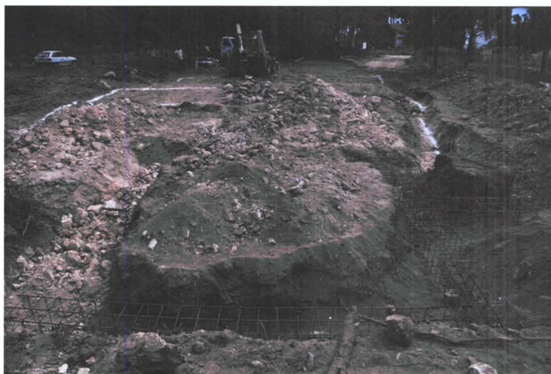
Figs. 3 i 4. Detalls del rebaix de les terres i del subsòl per a la construcció de la vivenda situada al carrer Puig i Cadafalch 48 del municipi de l'Escala.