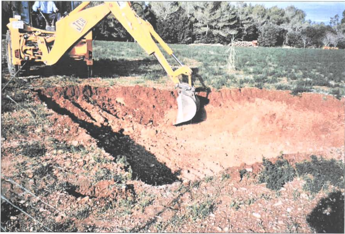
Foto. 3.- Vista de detall de les terres extretes durant la realització dels rebaixos.