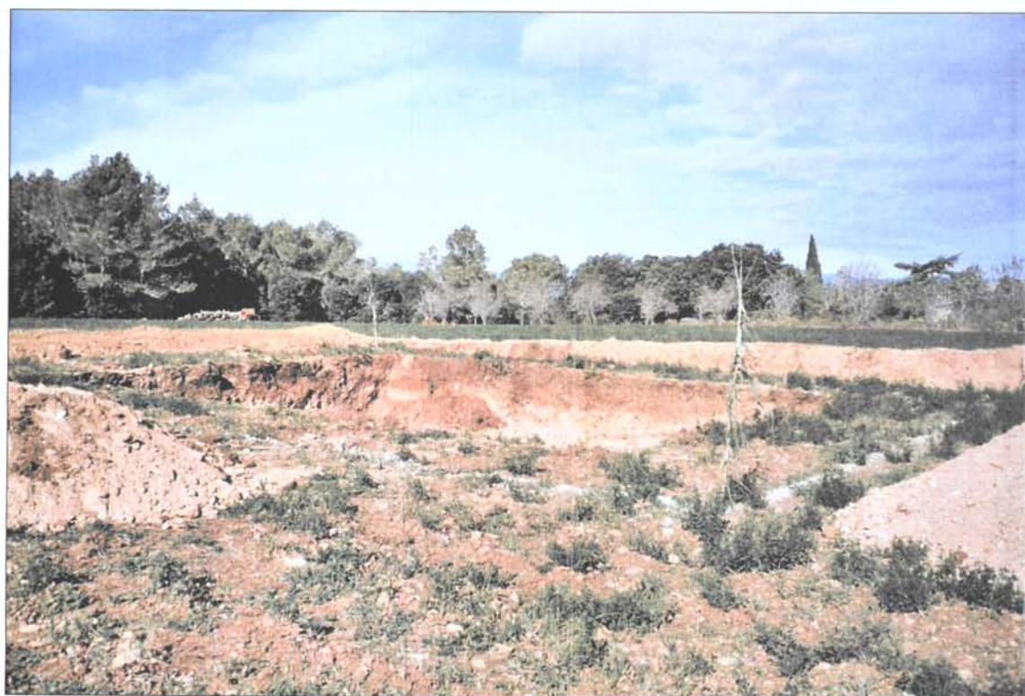
Foto. 6.- Vista de la zona on es va instal·lar la bassa d'aigua, un cop acabades les tasques d'excavació.