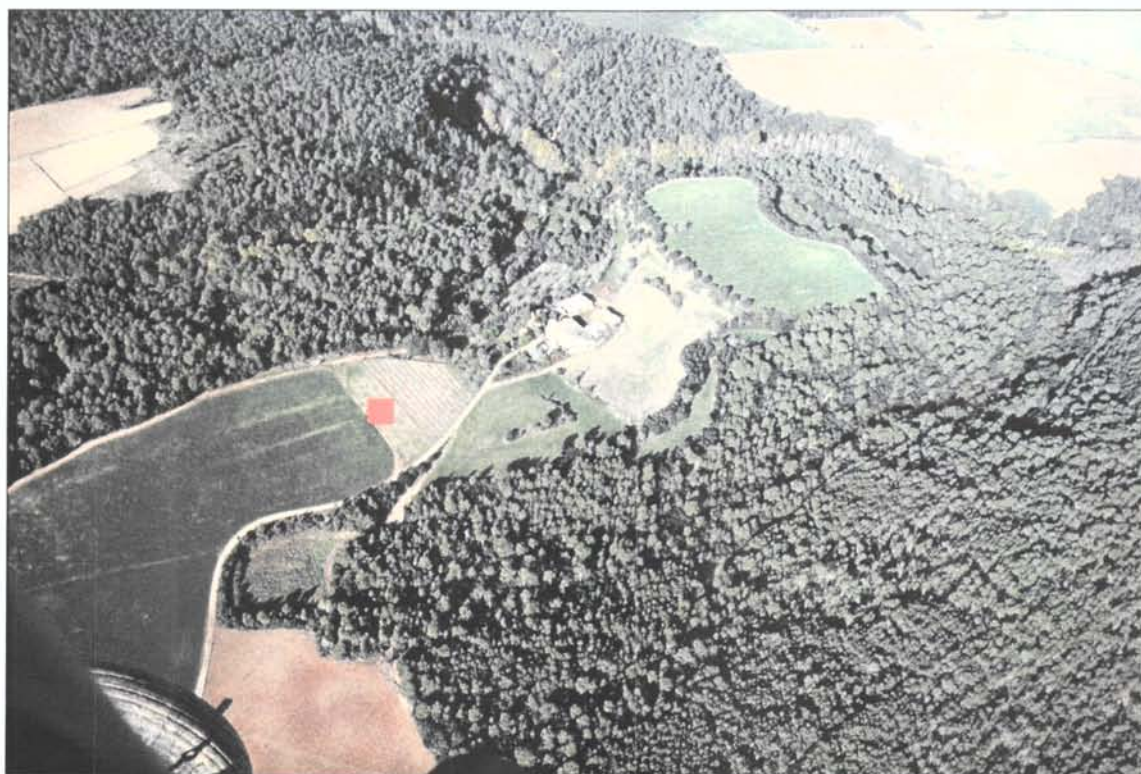
Foto. 1.- Vista aèria on s'observa l'emplaçament actual de la bassa hidràulica.