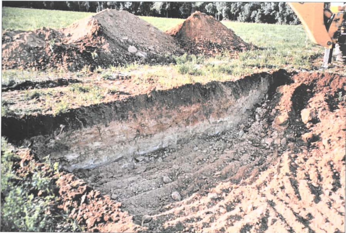
Foto. 4.- Vista del perfil sud.