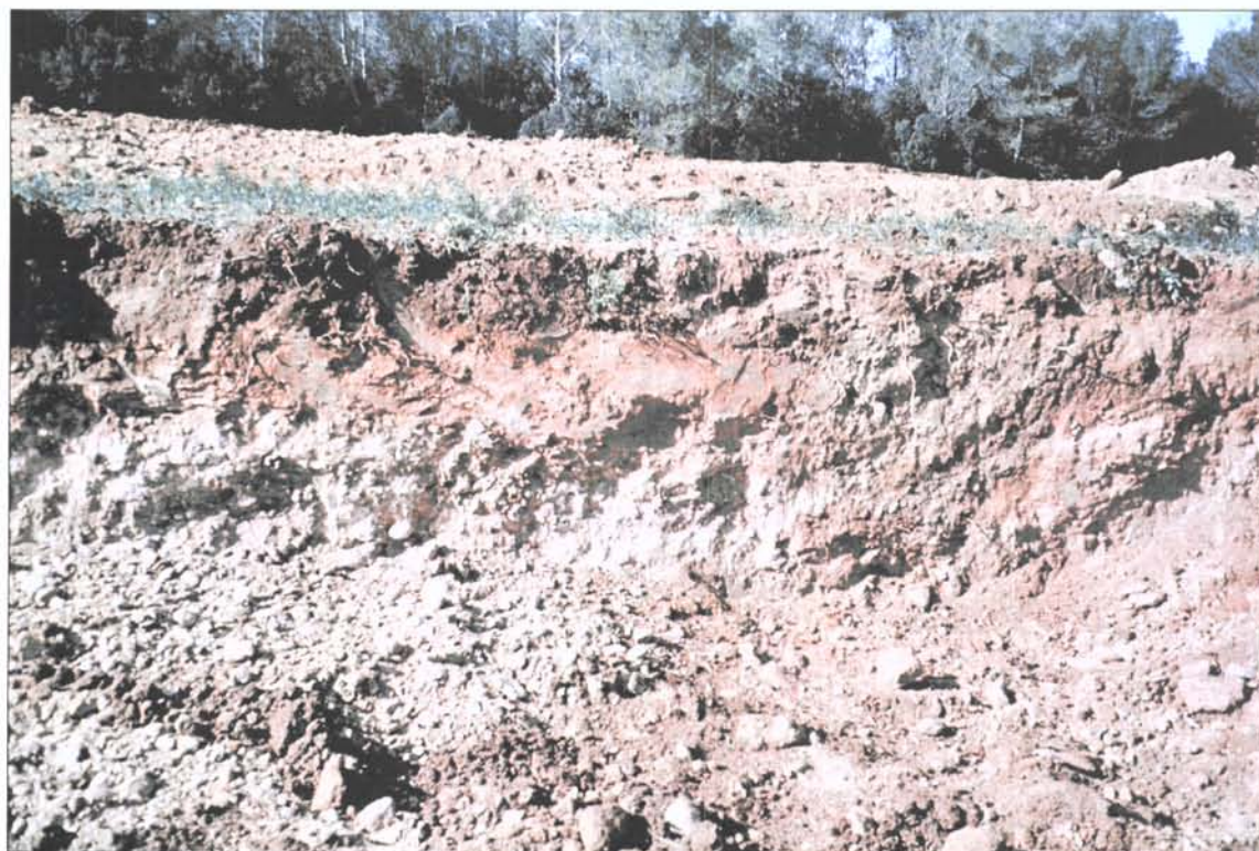
Foto. 5.- Vista del perfil oest.