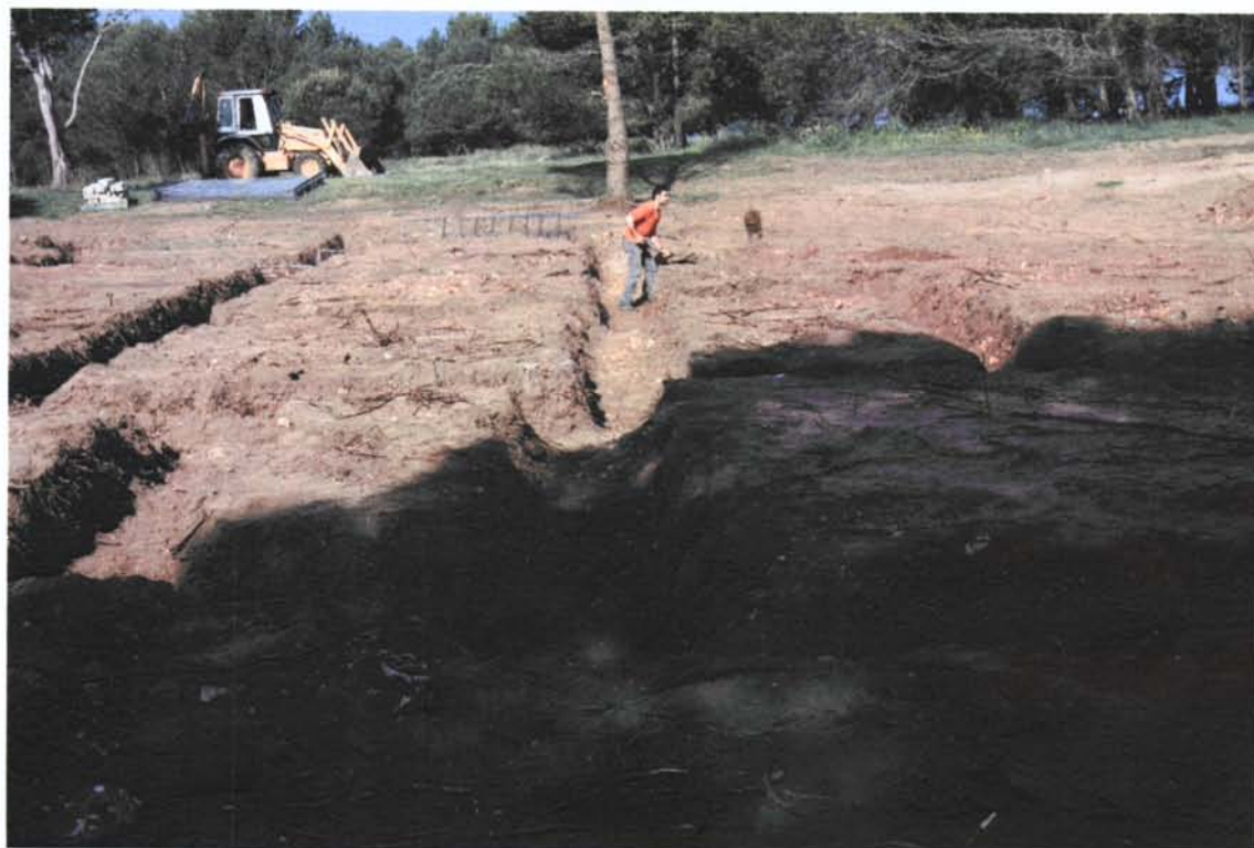
Figs. 2 i 3. Vista general i detall de les rases de fonamentació de la vivenda situada al carrer Domicià 15 del municipi de l'Escala.