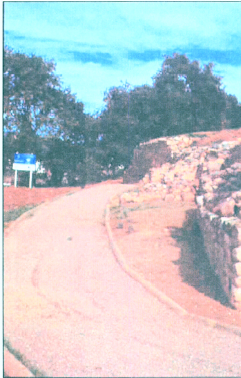
7. Vista general des del S del tram inferior del camí una vegada finalitzada la seva adequació.