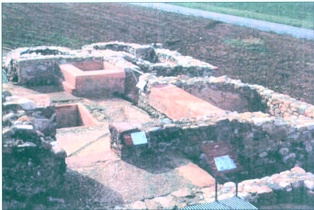
16. Vista de detall de l'edifici de les termes on es poden observar les diferents estructures restaurades i la senyalització de les diferents estances.