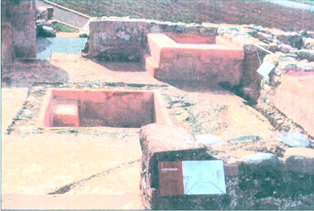
17. Vista de detall del vestidor o apodyterium una vegada finalitzats els treballs.