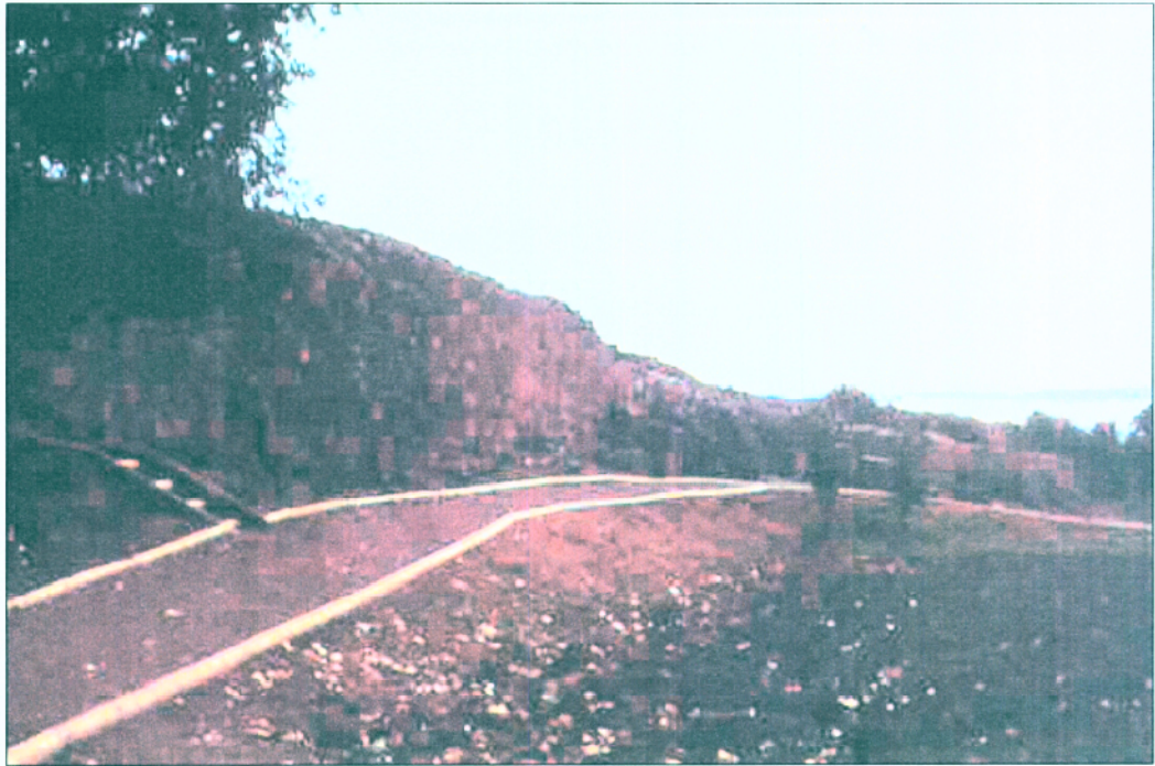
5. Vista general des del NO del tram inferior del camí, una vegada finalitzada la seva adequació.