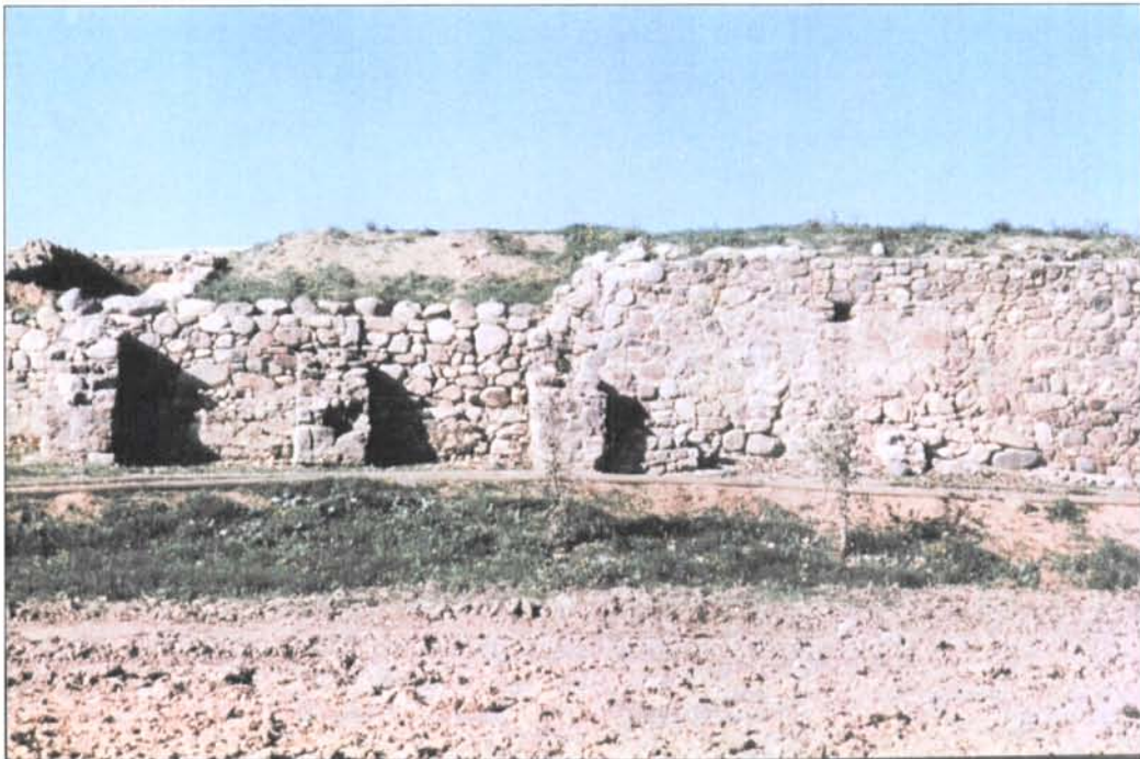
2. Vista des del O del mur de contraforts abans de la seva restauració l'any 1996