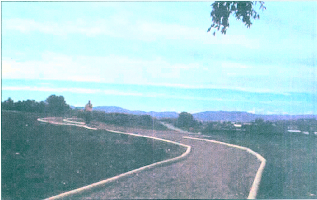
13. Vista general des del NO del tram superior del camí, en darrer terme la esplanada lúdica.