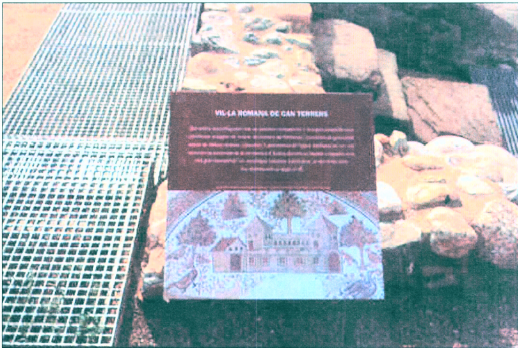
18. Detall del faristol i panell de senyalització d'inici de recorregut per a la visita del conjunt termal.