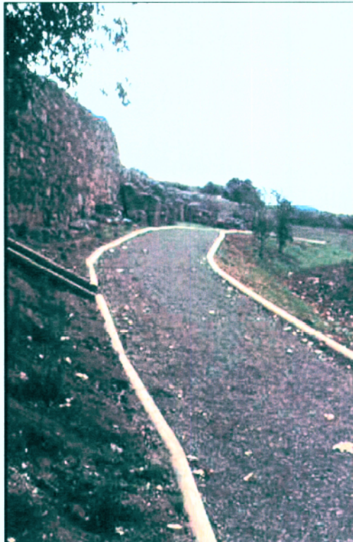
6. Vista general des del N del tram inferior del camí una vegada finalitzada la seva adequació.