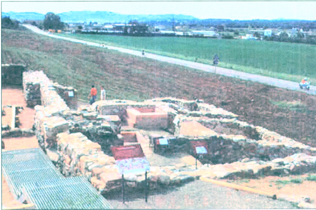
15. Vista general de l'edifici de les termes una vegada finalitzats els treballs