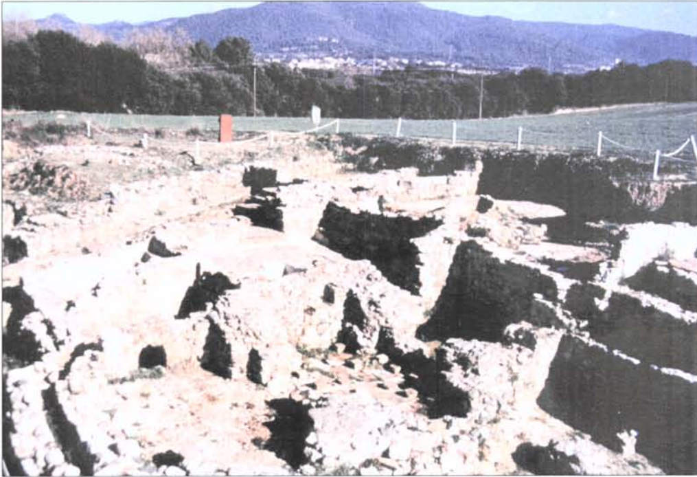
1. Vista general de l'edifici de les termes l'any 1996 abans de la seva neteja i restauració.