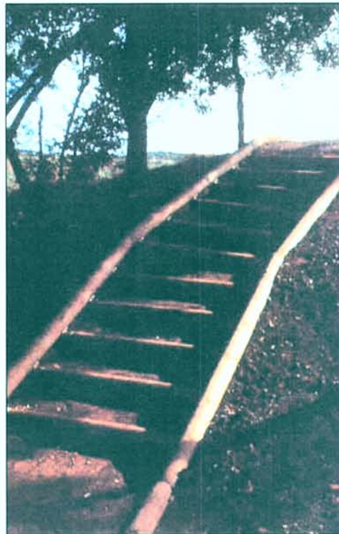
12. Vista de detall de l'últim tram d'escales d'accés al nivell superior des del bosc d'alzines.