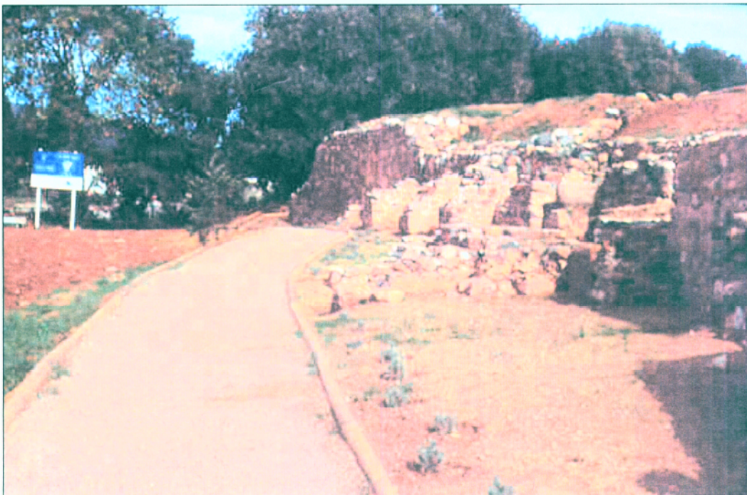
8. Vistes generals des del S del tram inferior del camí una vegada finalitzada la seva adequació.