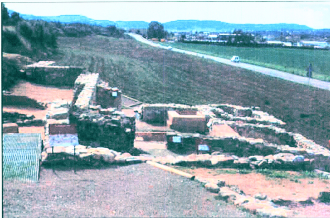
14. Vista general des del N de les diferents estances que configuren l'edifici termal. En primer terme l'esplanada ludica amb la senyalització, la qual es manté al llarg de tot el recorregut pels diferents àmbits.