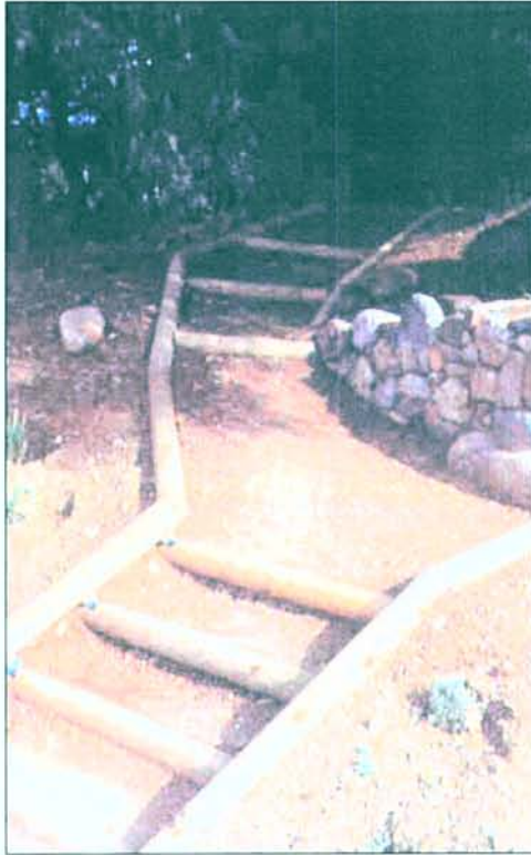
11. Vista de detall des del SO de les escales d'accés al nivell superior, tot travessant el petit bosc d'alzines situat a l'extrem nord del jaciment.