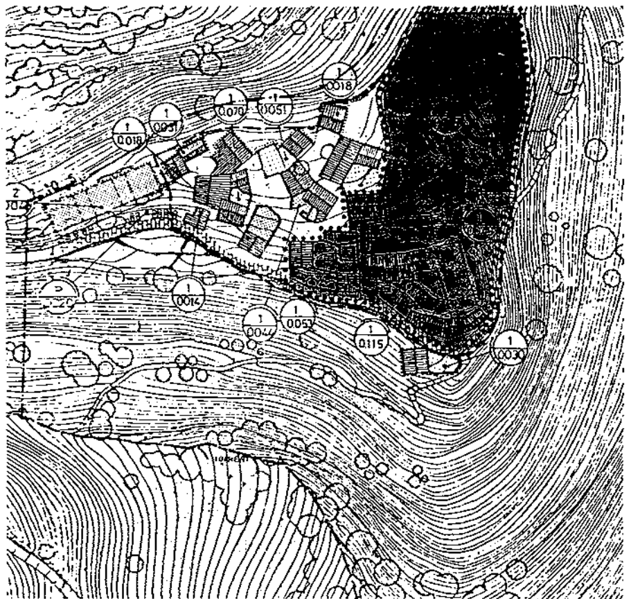
Església de Santa Maria de Cardet

Objecte: escultura. Denominació: imatge de Santa Maria. Tècnica: talla i policromia. Matèria: fusta. Mides: 100 cm x 50 cm x 25 cm. Autor: anònim. Època: s. XVIII.