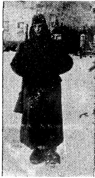
El clima ru o impone este uniforme