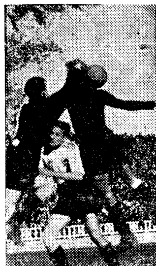
El portero despeja una situación apurada