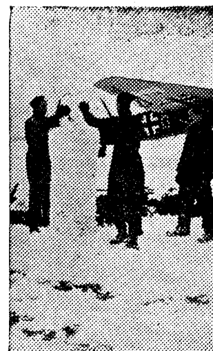
Aviones alemanes preparados para el combate