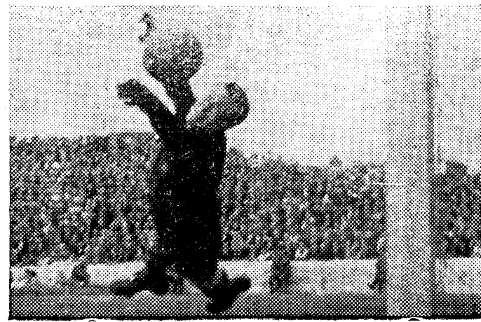
UNA BELLA ESCENA DEL PORTERO BARCELONISTA