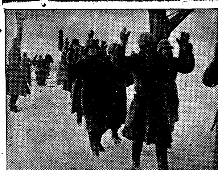
En la lucha contra el comunismo, las tropas del Eje hacen miles de prisioneros

La repoblación, a medida que se vaya intensificando, nos hará independientes económicamente en el capítulo importantísimo de la madera