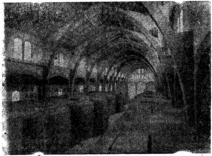
Esta grandiosa bodega vinícola es un exponente fiel de lo que puede la unión cooperativa en el seno de las Hermandades Sindicales. Al amparo del Nuevo Estado, la economía nacional se acrecienta y cristaliza ora en Cooperativas vinícolas, ora en Almacenes agrícolas, ora en Agrupaciones económicas potentes y prometedoras

El índice de temas fué publicado en "La Masía" en el número correspondiente al 12 de julio pasado.