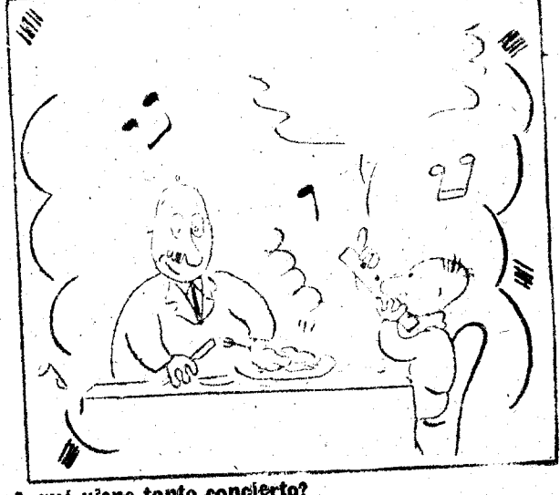
—¿A qué viene tanto concierto? —Es para que a lo menos se harte usted de... algo.