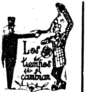
20 FEBRERO DE 1898

Para hoy se han organizado varios actos en su honor.