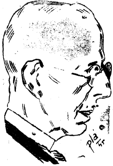
París, 11.—La Embajada de Suecia opone un mentís oficial a ciertos rumores que circularon en París y fuera

de París durante la mañana de hoy de que el rey Gustavo V había fallecido en su viaje de Hamburgo a esta capital, camino de la Costa Azul.