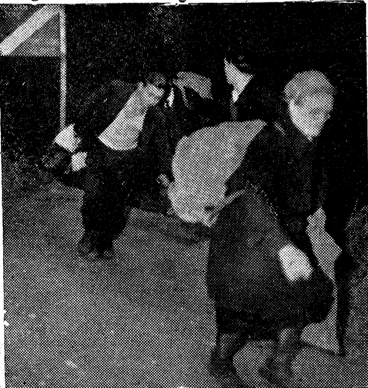
Fugitivos de la zona comunista de Alemania cruzan la frontera de la zona británica llevando consigo algunos objetos personales, huyendo de la "felicidad" con que "obsequian" a sus súbditos la Rusia soviética y sus satélites

Finalmente, dijo que esperaba que muchos de los peregrinos que vayan a Roma con motivo del Año Santo pasen por España. — Efe.