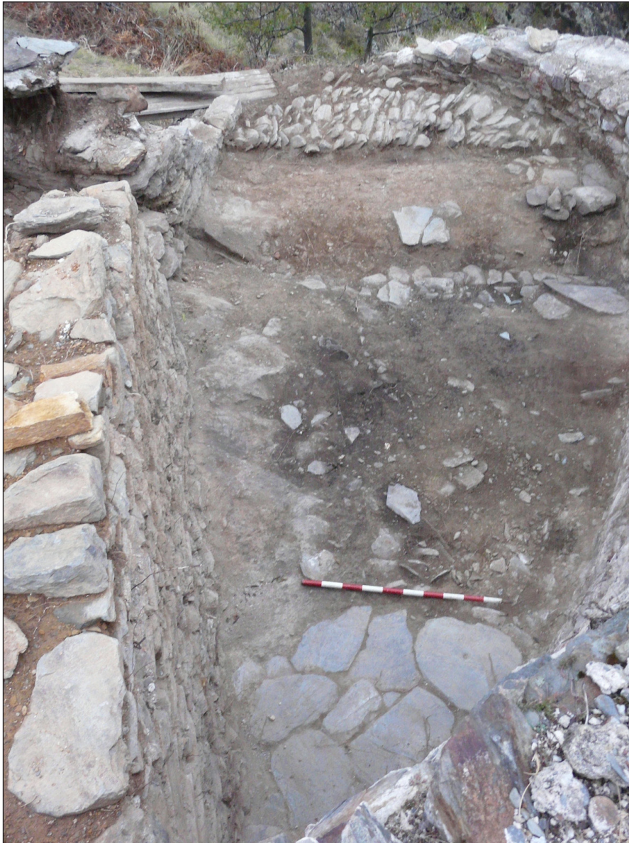
Figura 6. La torre nord-est. Al fons, les restes d'un mur de construcció anterior