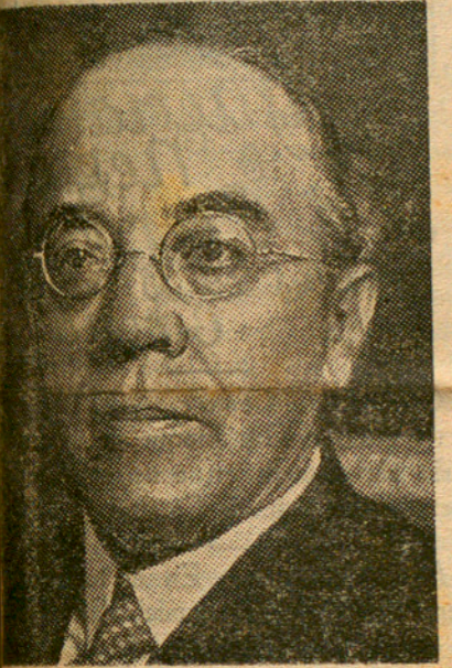
M. ALBERT SARRAUT del Govern de França que fou derrocat a la Cambra en discutir-se la reducció dels sous dels funcionaris.

ció de la política exterior. Sobre aquest punt creiem que no cal tenir preocupacions. Seguirà la mateixa línia que abans, com ho han fet tots els governs que s'han succeït en aquests darrers temps. Parlem de solidaritat amb la S. de N. i de col·laboració internacional. Es clar, com s'observa a Londres, que l'actual moment és especialment delicat. En efecte, a despit de les greus revelacions del "Petit Parisien" denotant la hipocresia de la política del Reich. Sembla, efectivament, que Alemanya vol iniciar negociacions directes amb França, a la qual cosa ha alludit John Simon en el seu discurs a la Cambra dels Comuns. França, com ja hem dit, no s'hi oposa, però Anglaterra ve una mica enllà imaginant-se que Alemanya tornarà a la Conferència del Desarmament. El moment és delicat, i, a part de la continuïtat de la política exterior, cal que els homes del Quai d'Orsay demostrin habilitat. Aquella continuïtat de la política internacional, existirà qualsevulla que sigui la solució de la crisi, que d'altra banda no pot ésser altra que un nou ministeri d'esquerra. Sota aquest aspecte, doncs, no cal