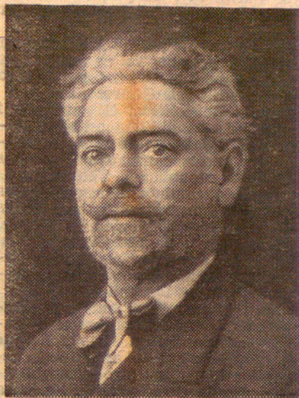
LAUREA DALMAU PLA

Dissabte fou detingut i empresonat el senyor Laureà Dalmau Pla, ex-diputat del Parlament català. Lamentem la seva detenció.