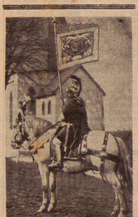
Un bavares armat. Heus ací un armat —un "manaia"— que és la màxima sensació en les festes de Setmana Santa de Traunstein (Baviera). El seu paper és brillantíssim en totes les cavalcades.