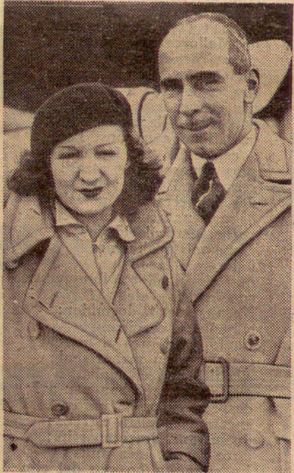
Viatge de noces

El cèlebre aviador anglès Campbell Black, el qual va guanyar el famós raid Anglaterra-Austràlia, acaba de casar-se amb la notable actriu Florence Desmond.