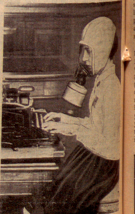
Model per a mecanògrafes

Durant les maniobres de les forces aèries d'Itàlia es repartiren aquestes disfresses protectores contra els gasos. Heus ací una pobre mecanògrafa lluint el damer model el qual gràcies a una finestra de celofan ofereix una major visibilitat.