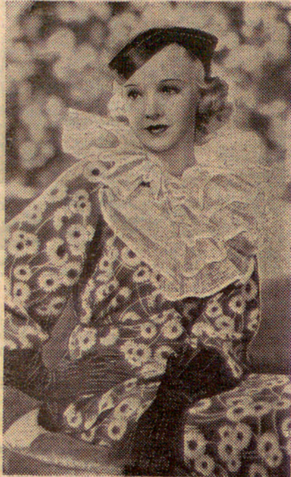
Model de primavera

Heus ací un elegantíssim model de primavera lluit per la bellíssima estrella Wendy Barris, en un concurs celebrat darrerament a Hollywood.