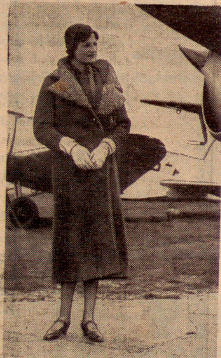
L'esposa de Mr. Eden

Heus ací l'esposa del cèlebre polític anglès Mr. Eden. Mentre el seu marit —com a ministre de Negocis Estrangers— vol arreglar la pau del món, ella es disposa a emprendre un viatge aeri a París.