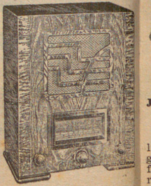
6 vàlvules Pts. 590