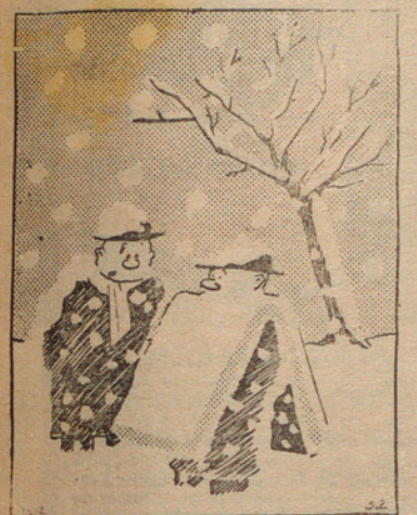
L'home anunci. — Si, fa un temps terrible, però em donen una pesseta l'hora per a passejar aquest cartell.