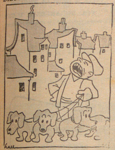
Gossos cadells... gossos cadells... a cinc pessetes el metre!