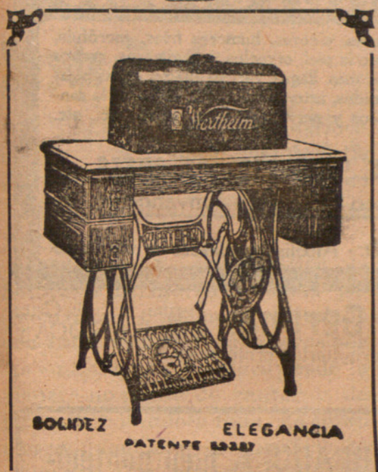
SOLIDEZ ELEGANCIA PATENTE 15287

Mañana, a las seis de la tarde, se reunirá la Comisión provincial.