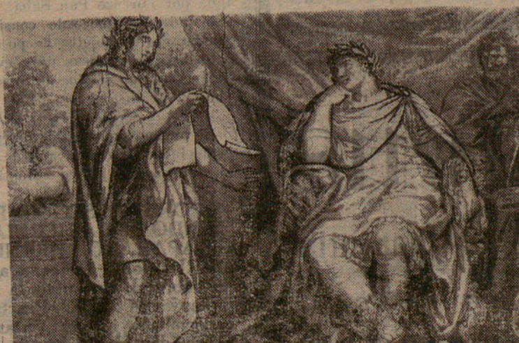
El bi-milenario de Virgilio.—Virgilio y Augusto, cuadro de L. de Cortone (pintor del siglo XVI).

No era, a nuestro entender, de una absoluta necesidad para los intereses provinciales, el que se invirtieran durante el ejercicio de 1929, por diferentes conceptos del presupuesto, la cantidad de 18.474'85 pesetas en servicios de autos de alquiler, 52.287'41 pesetas en viajes, homenajes, subcripciones y banquetes, 9.201'65 pesetas en fotografías y gastos menores de Mayordomía, etc., aunque ello no fuera objeto de responsabilidad legal, ya que la Corporación tiene facultad discrecional para ello y para mucho más, pero ante un exceso de