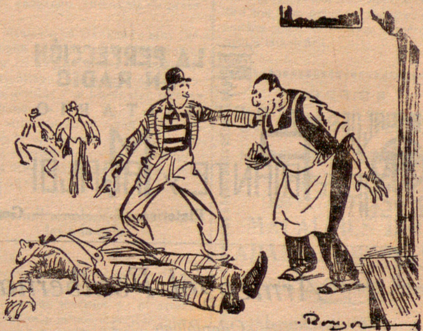
NO ES EXIGENTE

Se ha acordado desmontar la estación Radio-Maroc e instalarla en el pueblo de Meknes. Se le aumentará la energía hasta 15 kw. Estos cambios se harán el próximo año.