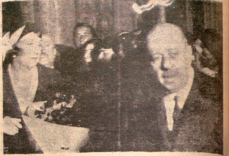
París. — La ex soberana de España a su llegada a la estación de Orsay donde es recibida por el señor Quiñones de León, el ex embajador.

juego sincero el temor de que la burla no sería tolerada y de que el pueblo les haría pagar esta vez muy cara la felonía que cometerían.