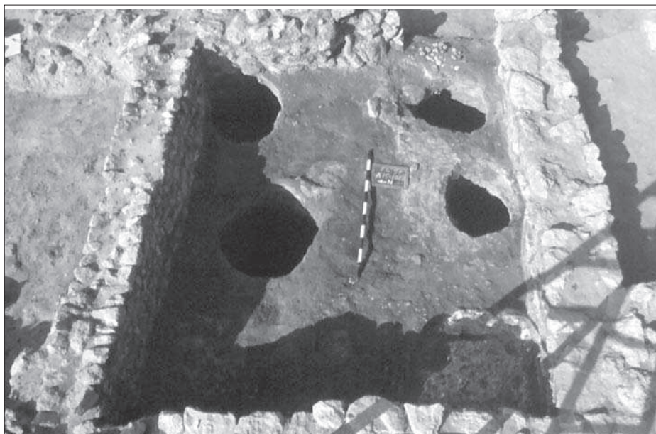
Figura 4. Vista de l'àmbit 15, amb quatre sitges.

ges amb els fogars. Aquesta dada indica una especialització funcional dels diferents àmbits, amb zones d'habitatge i zones d'emmagatzematge i processament de productes agrícoles ben diferenciades.