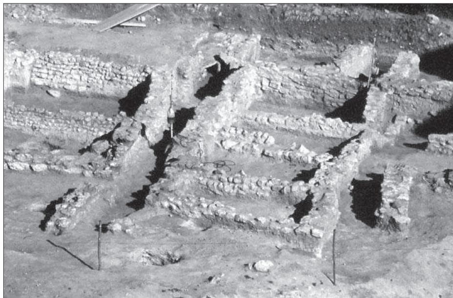
Figura 3. Vista dels àmbits separats pel carrer.

nalment, a l'àmbit A-27, ens trobem amb una llar de tipus semiexcavat no limitat, si bé aquesta definició no encaixa del tot amb la forma de la llar, ja que aquesta es troba del tot excavada i la seva superfície superior queda a la mateixa alçada del paviment. La seva planta és quadrada, amb unes dimensions de poc més d'un metre de costat, i presenta una capa refractària de codolets recoberta d'argila. Aquest darrer tipus es repetirà en la fase posterior, Era del Castell III, concretament en els àmbits A-29 i de nou en l'A-27.