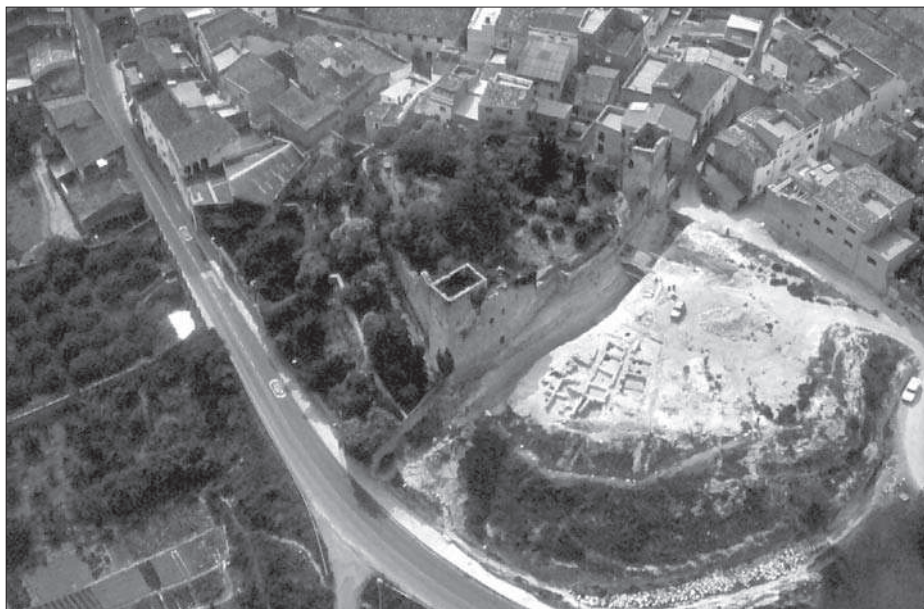
Figura 1. Vista general del turó del Castell del Catllar.

la investigació no podem concretar una datació acurada, podem avançar que ens trobem en un moment de l'edat del bronze final.