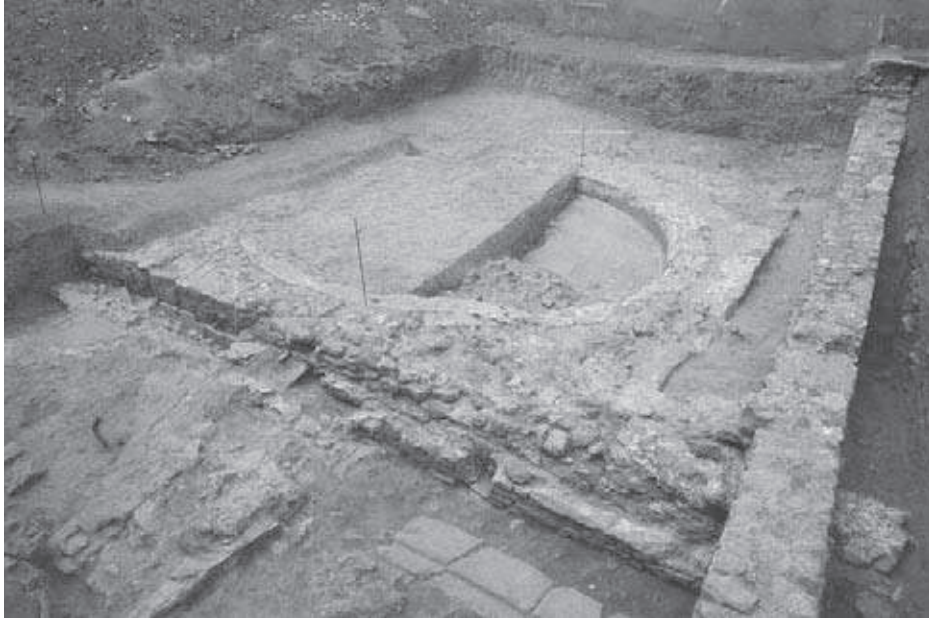
Figura 3: Fotografia de la capçalera de l'església. Estat en que ha quedat després de la primera fase d'excavacions.

arqueològic està assignant a l'absis una cronologia d'abandonament que, de moment, només podem situar genèricament dins de l'antiguitat tardana (segles IV-VIII).